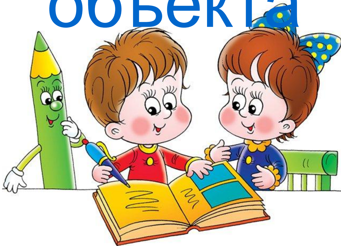
Схема состава объекта