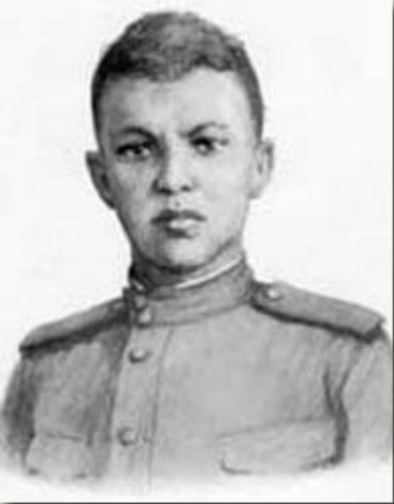
Матросов Александр Матвеевич Стрелок- автоматчик, Герои Советского Союза