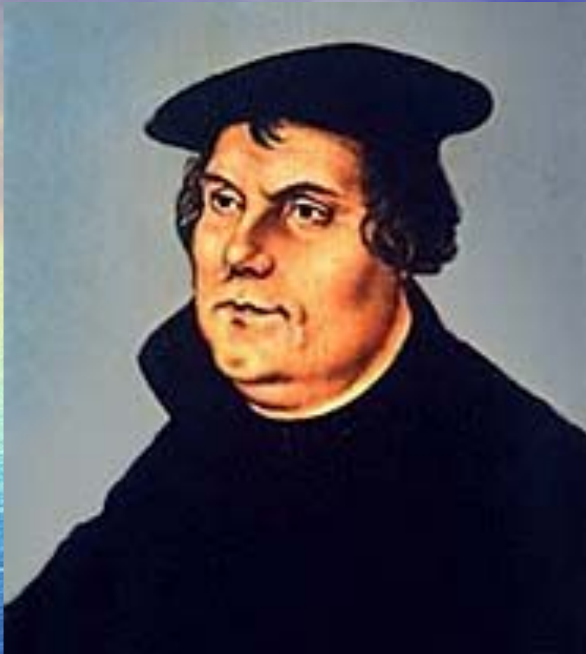
ЛЮТЕР (Luther) Мартин (10 ноября 1483— 18 февраля 1546)