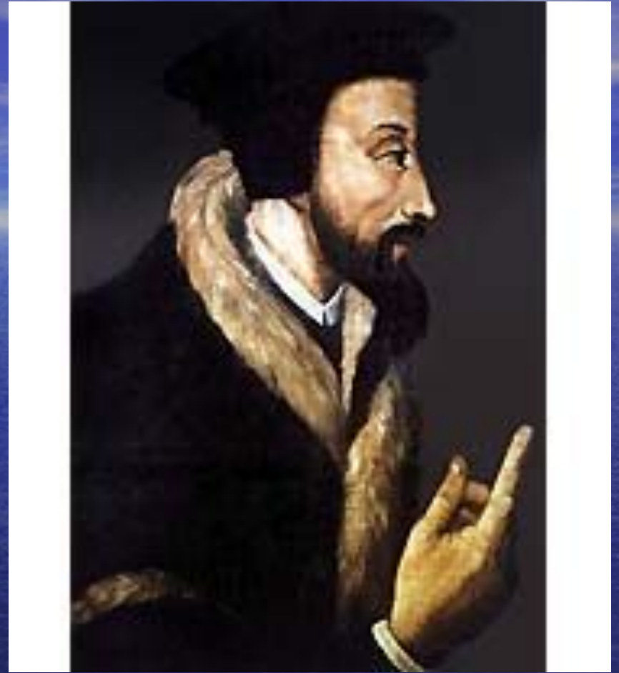
кальвинистская (пресвитерианская) церковь