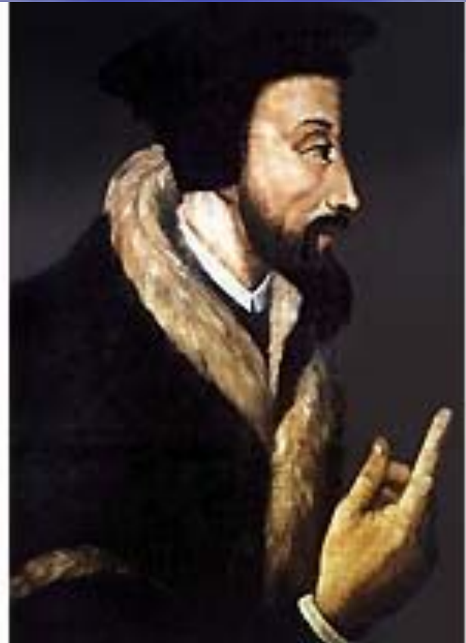
КАЛЬВИН Жан (Calvin) (10 июля 1509 — 27 мая 1564)