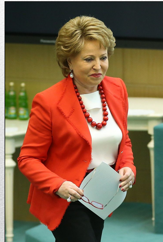
В.И. Матвиенко Председатель Совета Федерации ФС РФ