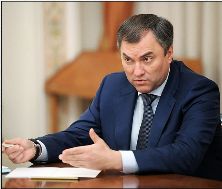
В.В. Володин Председатель Государственной Думы ФС РФ