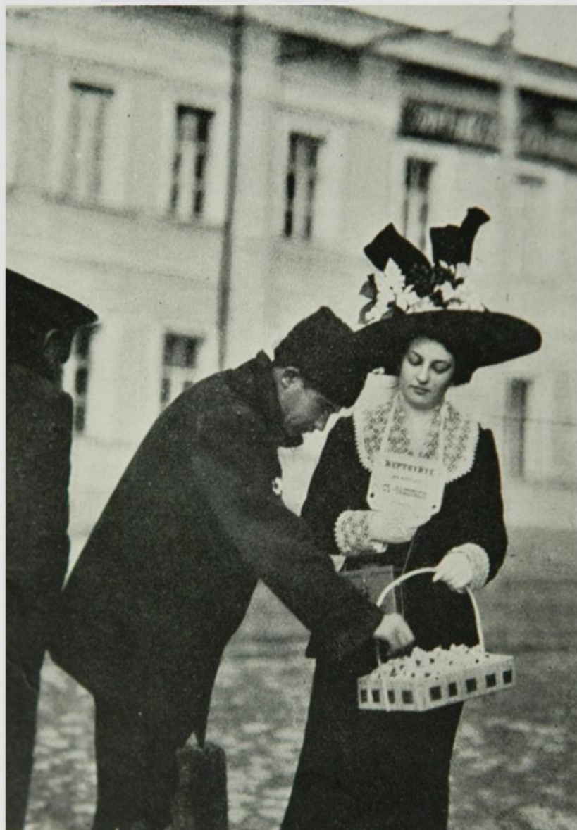
Нижний Новгород 1911