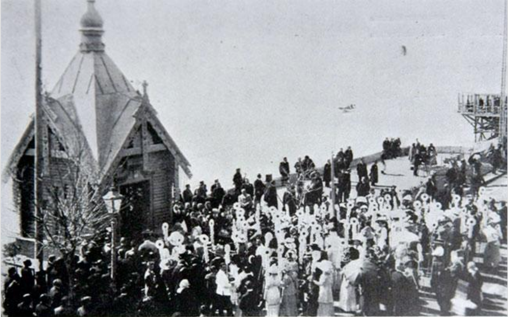
Ялта. Молебствие у часовни на набережной въ день «бълаго цвѣтка».

Особым украшением были юные девушки , которые вместе с детьми ходили с шестами, увитыми символическими белыми цветами и собирали пожертвования, выкрикивая :«Жертвуйте на борьбу с чахоткой!», «Жертвуйте на дела милосердия!»