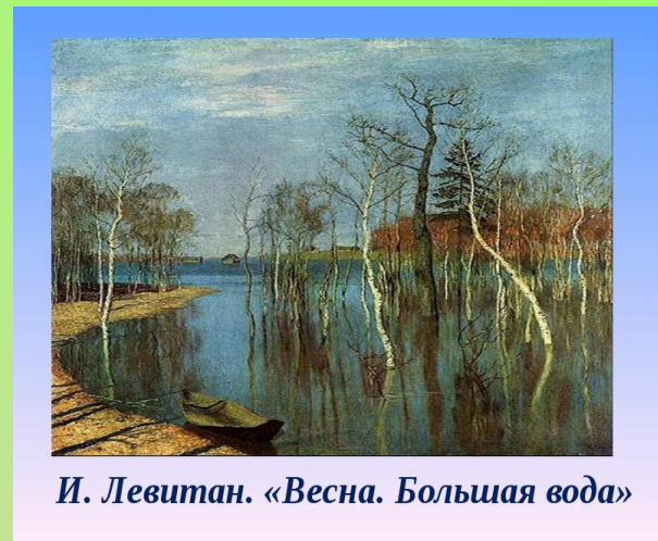
И. Левитан. «Весна. Большая вода»