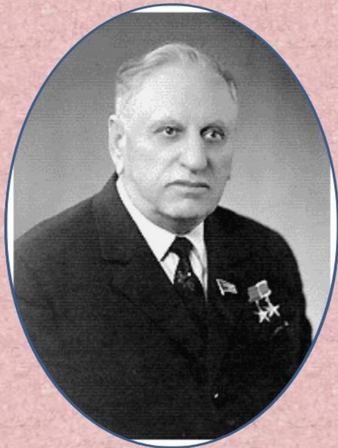
Павел Пантелеймонович Лукьяненко

Академик. Дважды Герой Социалистического труда, создатель 46 сортов озимой пшеницы. «Хлебный батяко»