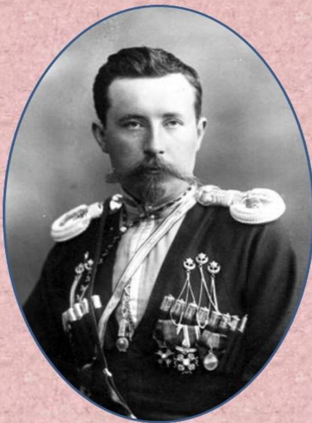
Фёдор Андреевич Щербина

Ученый и общественный деятель, написавший двухтомную историю кубанского казачьего войска.