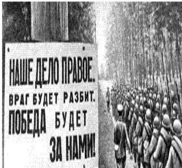
Колонна пехоты движется на фронт. 1941 г.