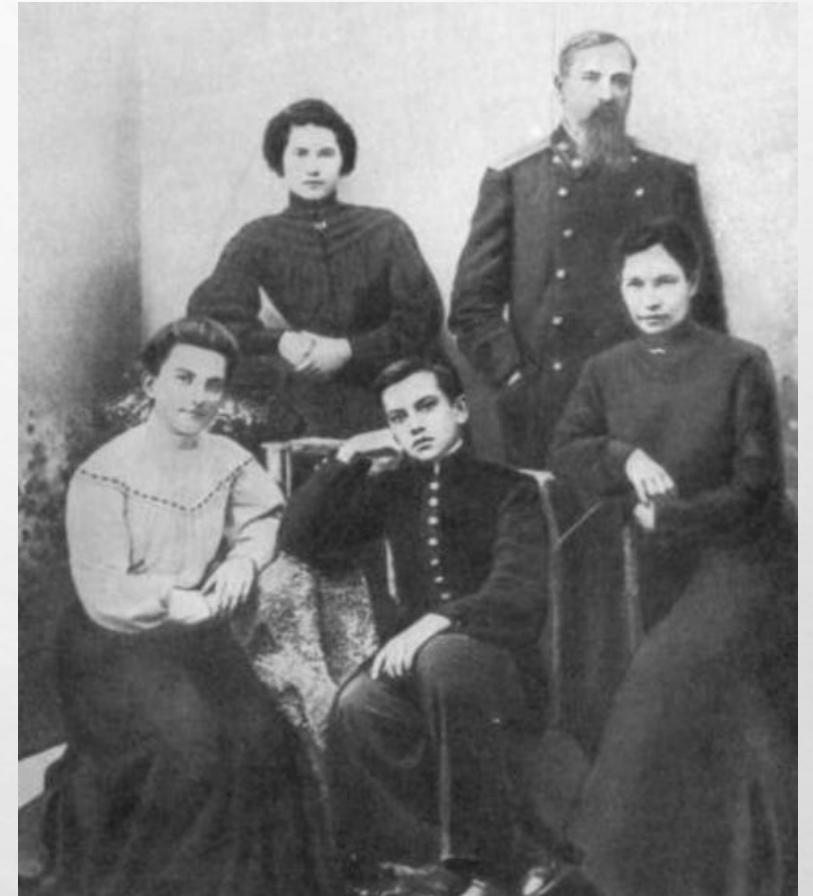
На фото сім'я Маяковського.

В. В. Маяковський народився у селі Багдаді, Грузія, у родині був останньою третьою дитиною. Батько — дворянин, служив лісничим, предки були — з козаків Запорізької Січі. Мати, Олександра Олексіївна, походила із роду Кубанських козаків. Хоча у школі та із друзями хлопчик спілкувався грузинською, вдома всі один до одного звертались лише російською. 1902 року Володимир вступає до Кутаїської гімназії. Після смерті батька 1906 року Маяковський разом із матір'ю та сестрами переїздить до Москви. Там він вступає до школи № 91 і навчається у одному класі із братом Бориса Пастернака Шурою.