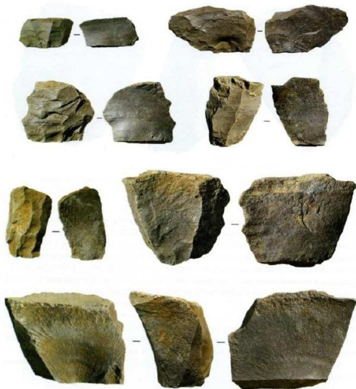
Рис. 6. Отщепы из окварцованного доломита. Стоянка Кермек.