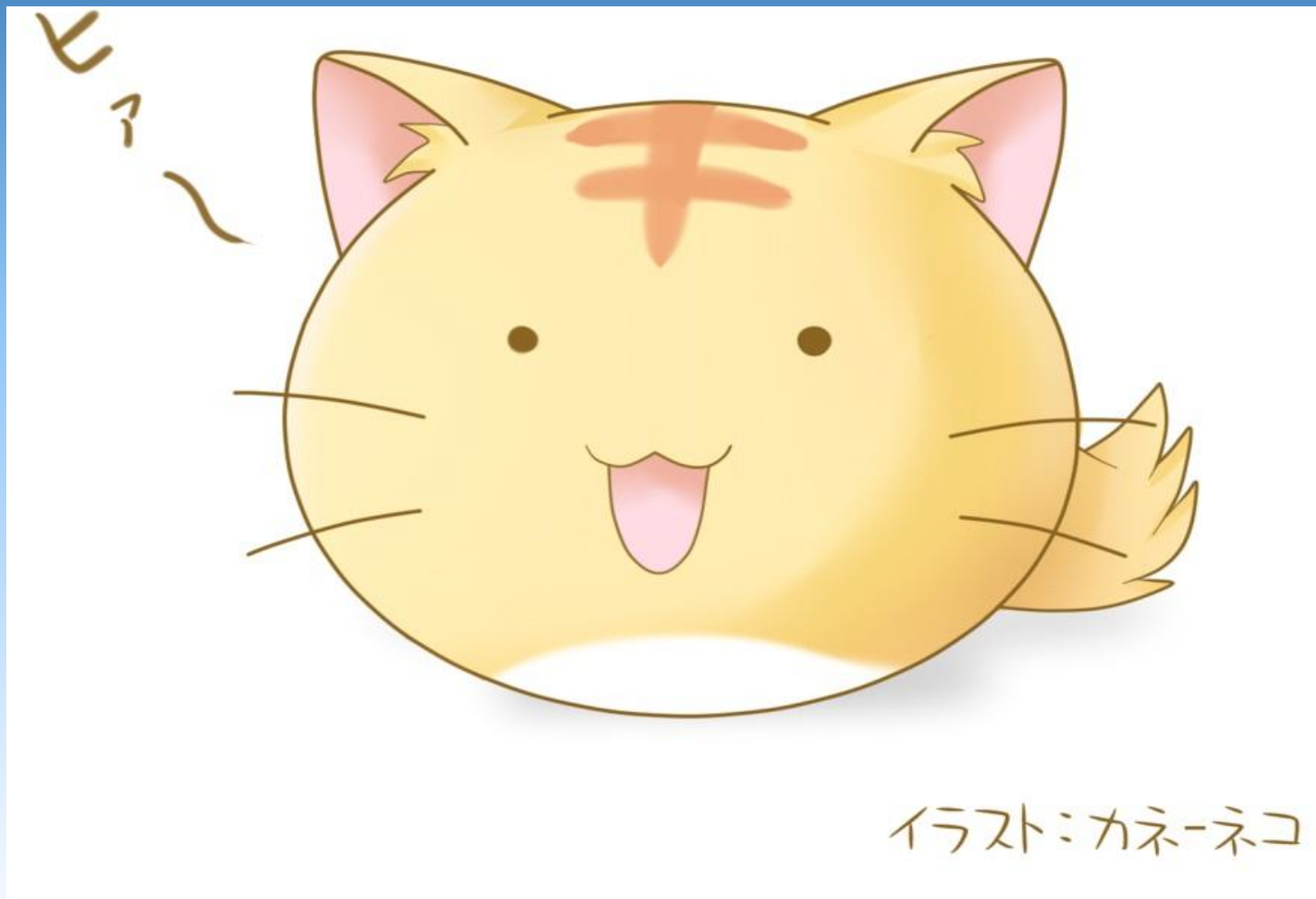
イラスト:カネ-ネコ