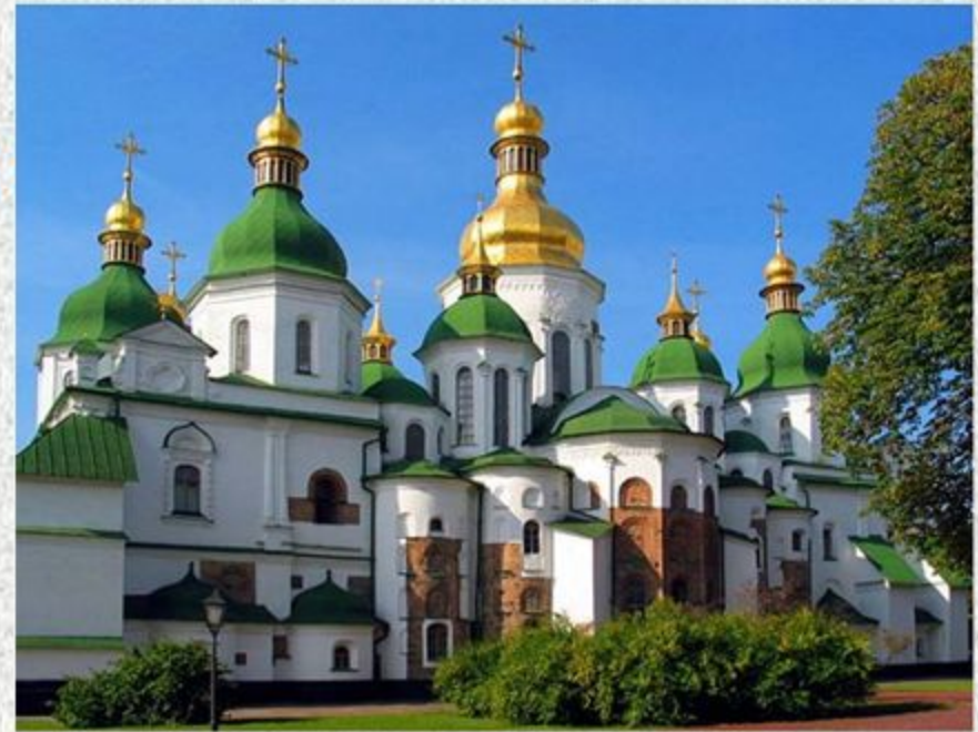
Софіївський собор у Києві (сучасний вигляд).