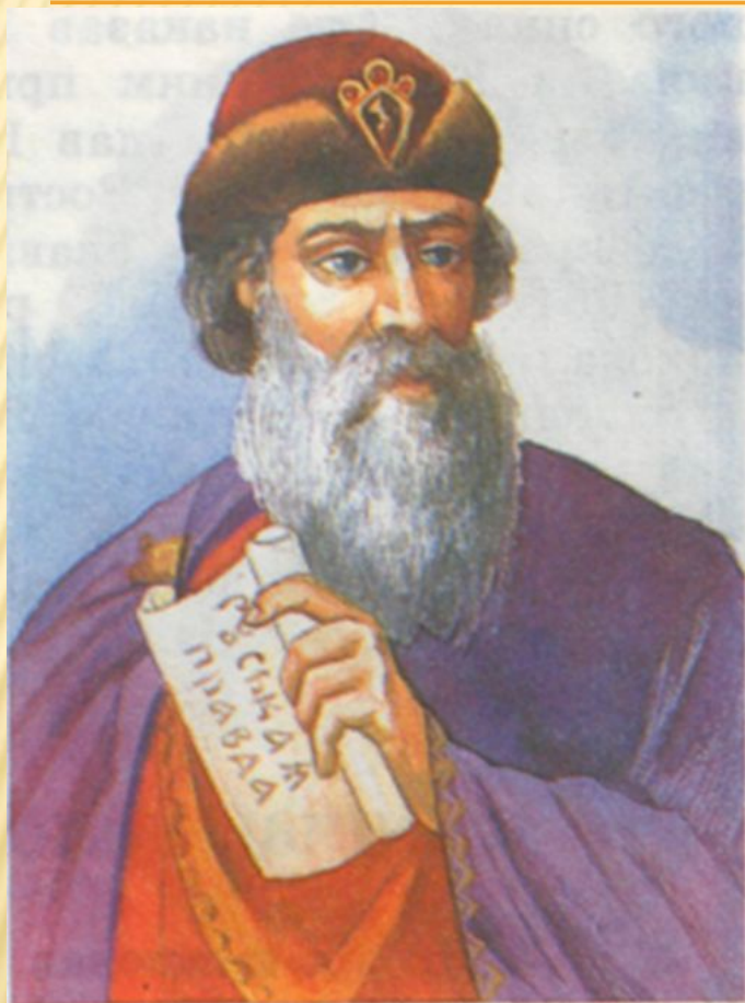
Князь Ярослав Мудрый