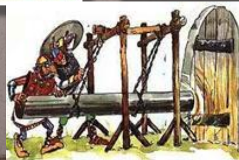
Оружие МОНГОЛЬСКИХ ВОИНОВ