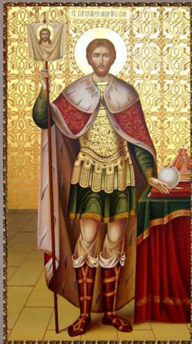
Икона Александра Невского

За великий подвиг православная церковь причислила князя Александра Невского к лику святых.