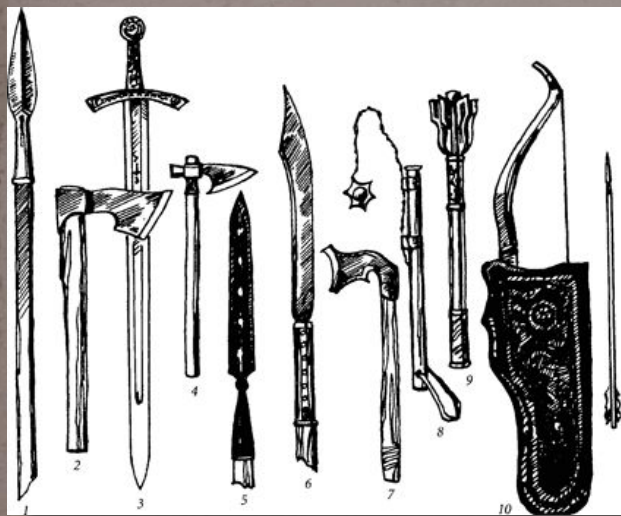
Оружие русских воинов

Но монгольское войско сильно было не только своей конницей. У него были совершенно новые виды оружия, которого не было у русских.