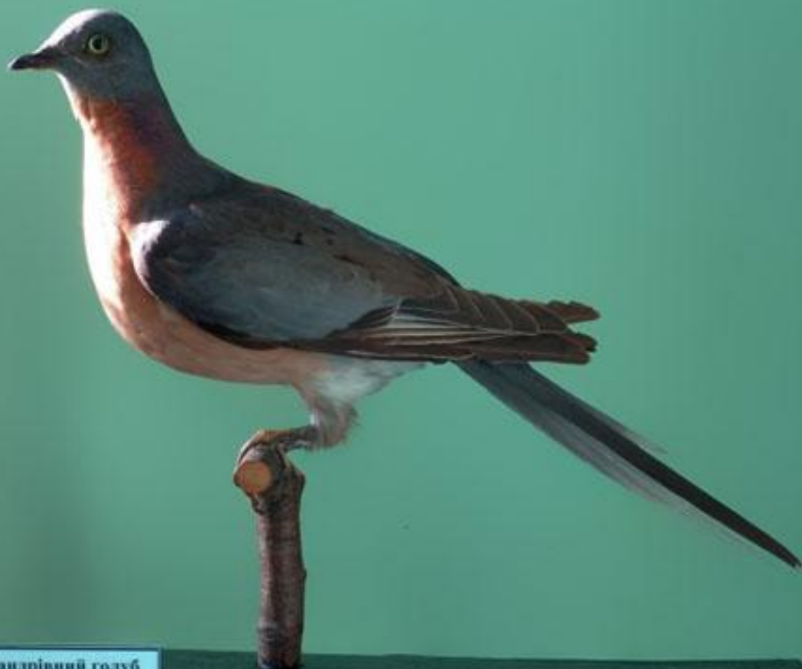
Мандрівний голуб Странствуючий голубь. Ectopistes migratorius (L.)