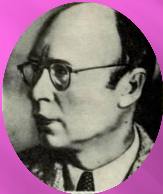
Сергей Сергеевич Прокофьев

Кантата прозвучала, как решительное предостережение, как грозное напоминание о том, что ждет врага, который решит напасть на нашу Родину.