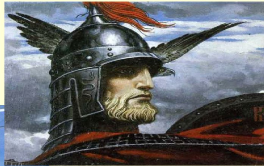
Картины Константина Васильева