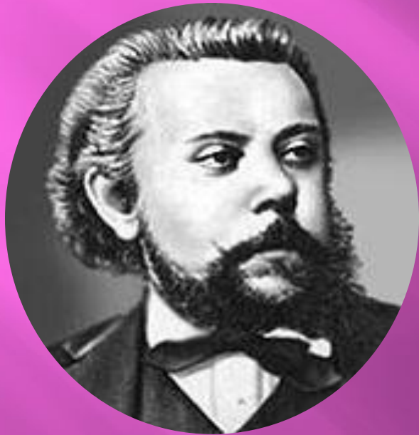
Модест Петрович Мусоргский