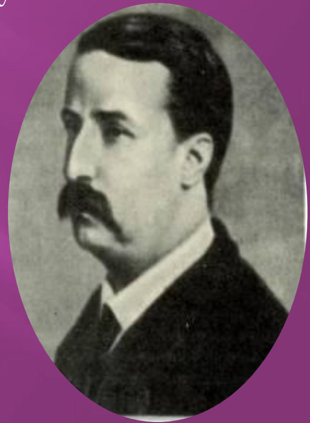
Александр Порфирьевич Бородин

Обсуждение после прослушивания было бурным: Модест Петрович Мусоргский предложил её назвать «Славянская героическая», однако, критик Владимир Васильевич Стасов запротестовал: «Не вообще славянская, а конкретно – русская, богатырская!». «Богатырская» - это название Второй симфонии А.П.Бородина носит и по сей день. Сам же композитор говорил о своём произведении, что в медленной части “желал нарисовать фигуру Баяна, в I части – собрание русских богатырей, в финале – сцену богатырского пира при звуке гусель, при ликовании народной толпы”.