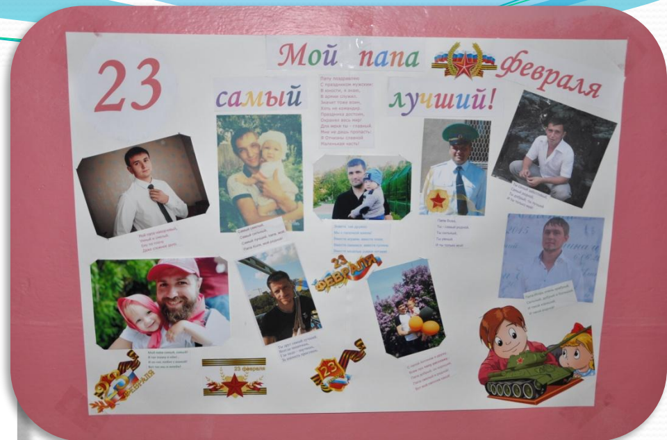
Стенгазета «Мой папа самый лучший!»