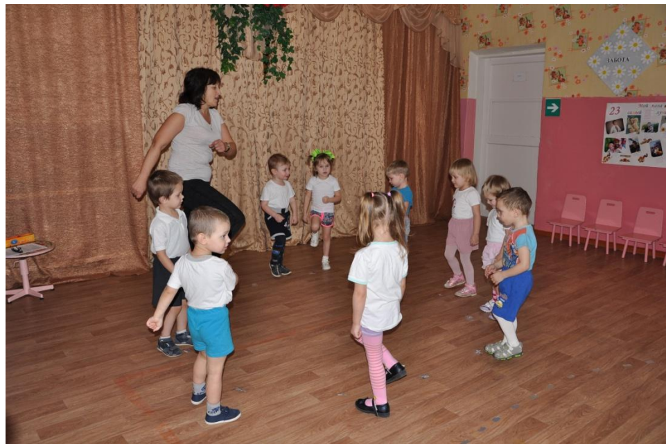
Проведение подвижных игр