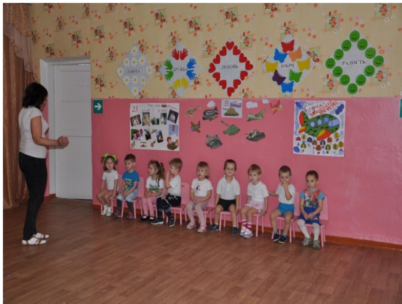
Проведение с детьми бесед о празднике «Защитники Отечества»