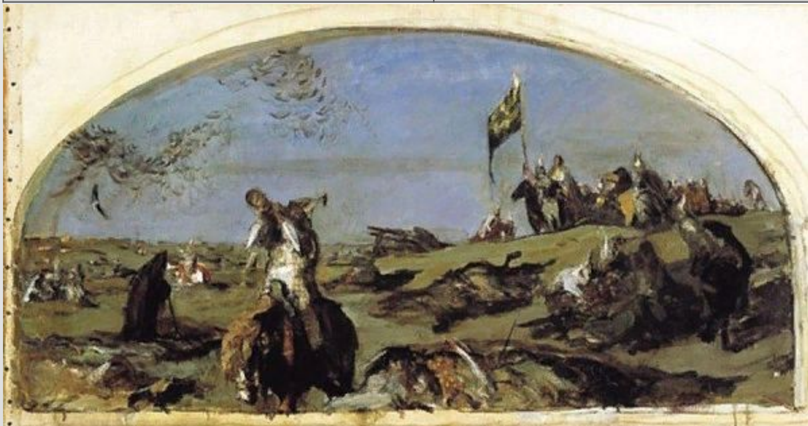
Валентин Серов. После Куликовской битвы, ЭСКИЗ