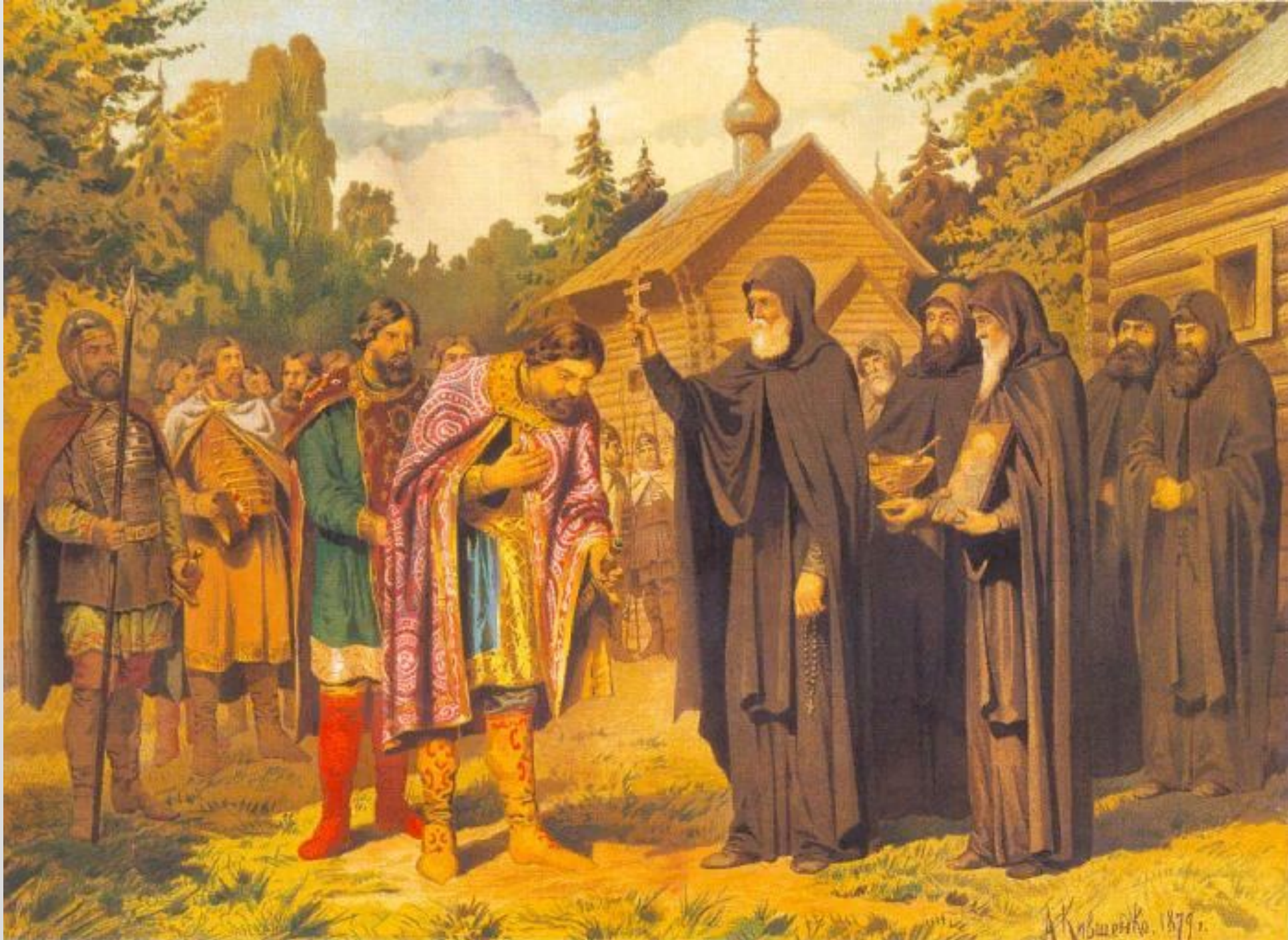
А. Кившенко. Прп. Сергий Радонежский благословляет св. бл. великого кн. Димитрия Донского на Куликовскую битву