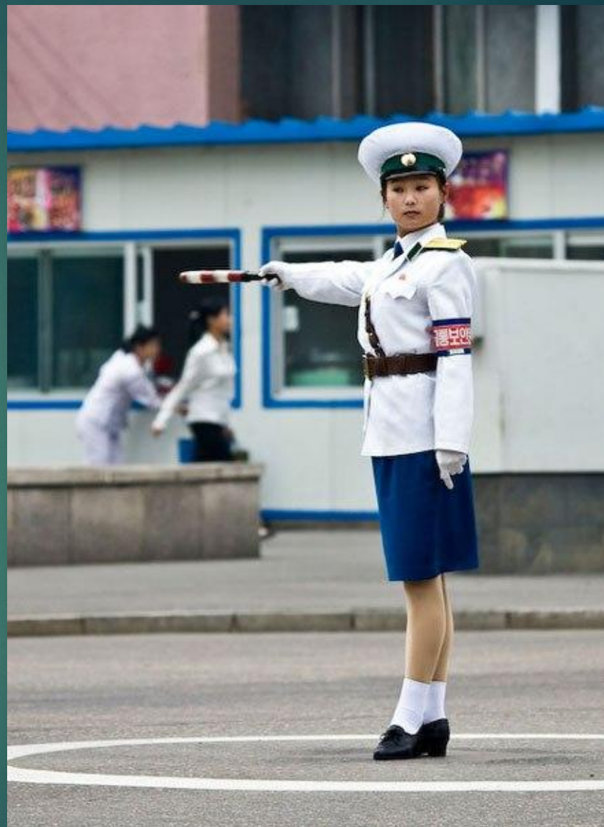
Девушки-регулировщицы общественного движения