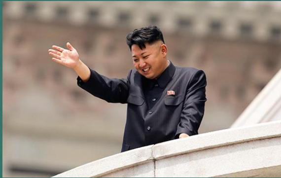
Президент КНДР - Ким Чен Ын