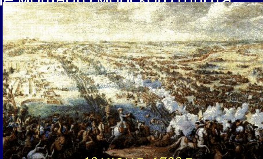
10 июня 1709 г. Полтавское сражение