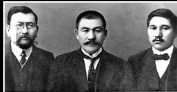
А. Байтұрсынов, А. Бөкейханов және М. Дулатов