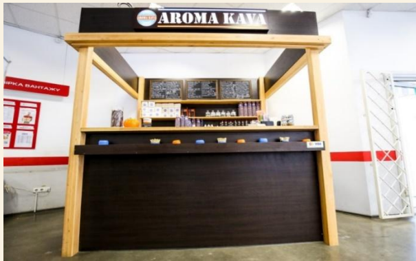
XS Кофейня типа кофе островок. Ассортимент: напитки, десерты.

Готовая концепция адаптирована под разные форматы от 6м кв. до 150 м.кв.