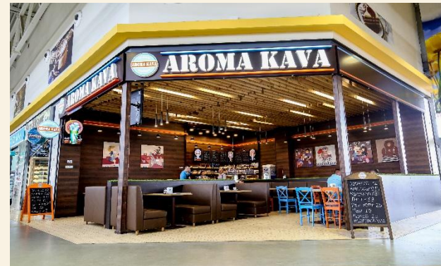
L Кофейня со входом. Ассортимент: напитки, десерты, выпечка, кухня.