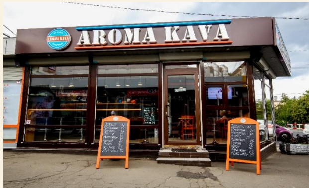
M Кофейня со входом. Ассортимент: напитки, десерты, выпечка