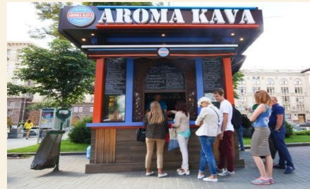
S Кофейня без входа. Ассортимент: напитки, десерты, выпечка.