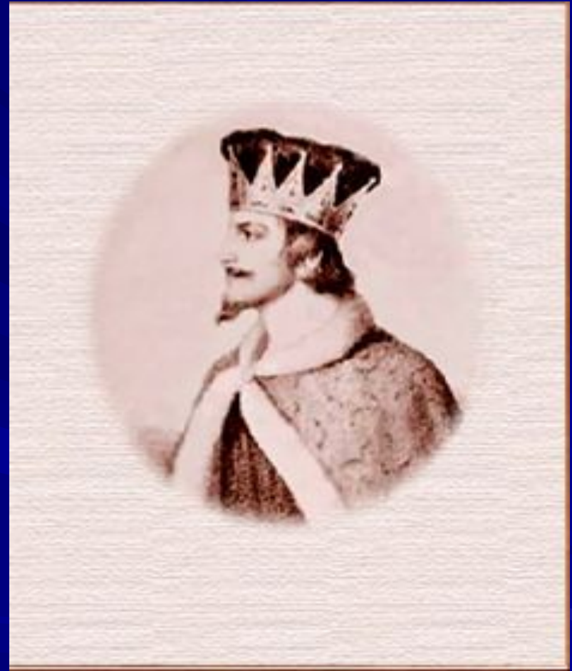
Святополк I Окаянный.