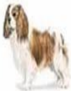
Кинг Чарльз Спаниель