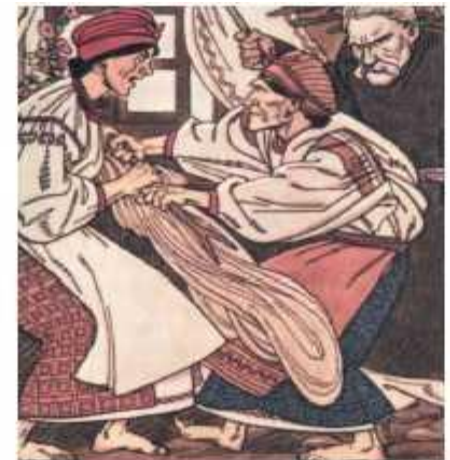
Віктор Полтавець. Ілюстрації до повісті «Кайдашева сім'я»