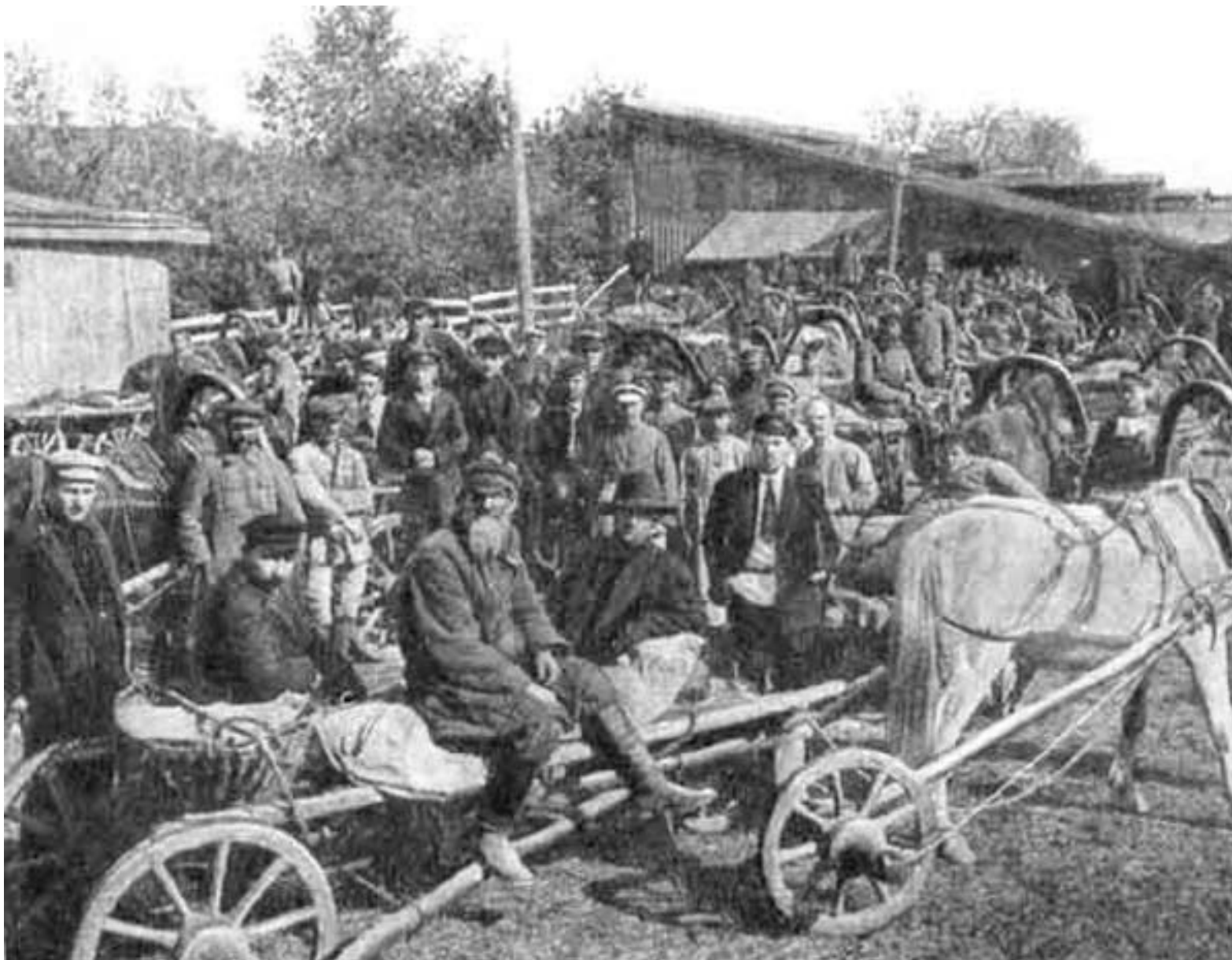
Сдача зерна по продналогу, 1921 г.