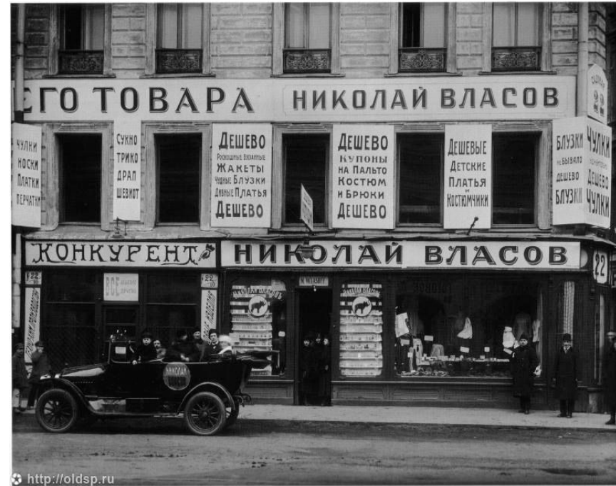
Одна из улиц Ленинграда во времена НЭПа