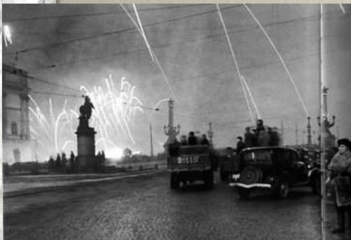
ВОЕННЫЕ ДЕЙСТВИЯ НА СЕВЕРО-ЗАПАДНОМ НАПРАВЛЕНИИ. Январь–февраль 1944 г.

12-18 января 1943 г. в результате операции «Искра» была прорвана блокада, а 14 - 27 января 1944г. осада города была снята.