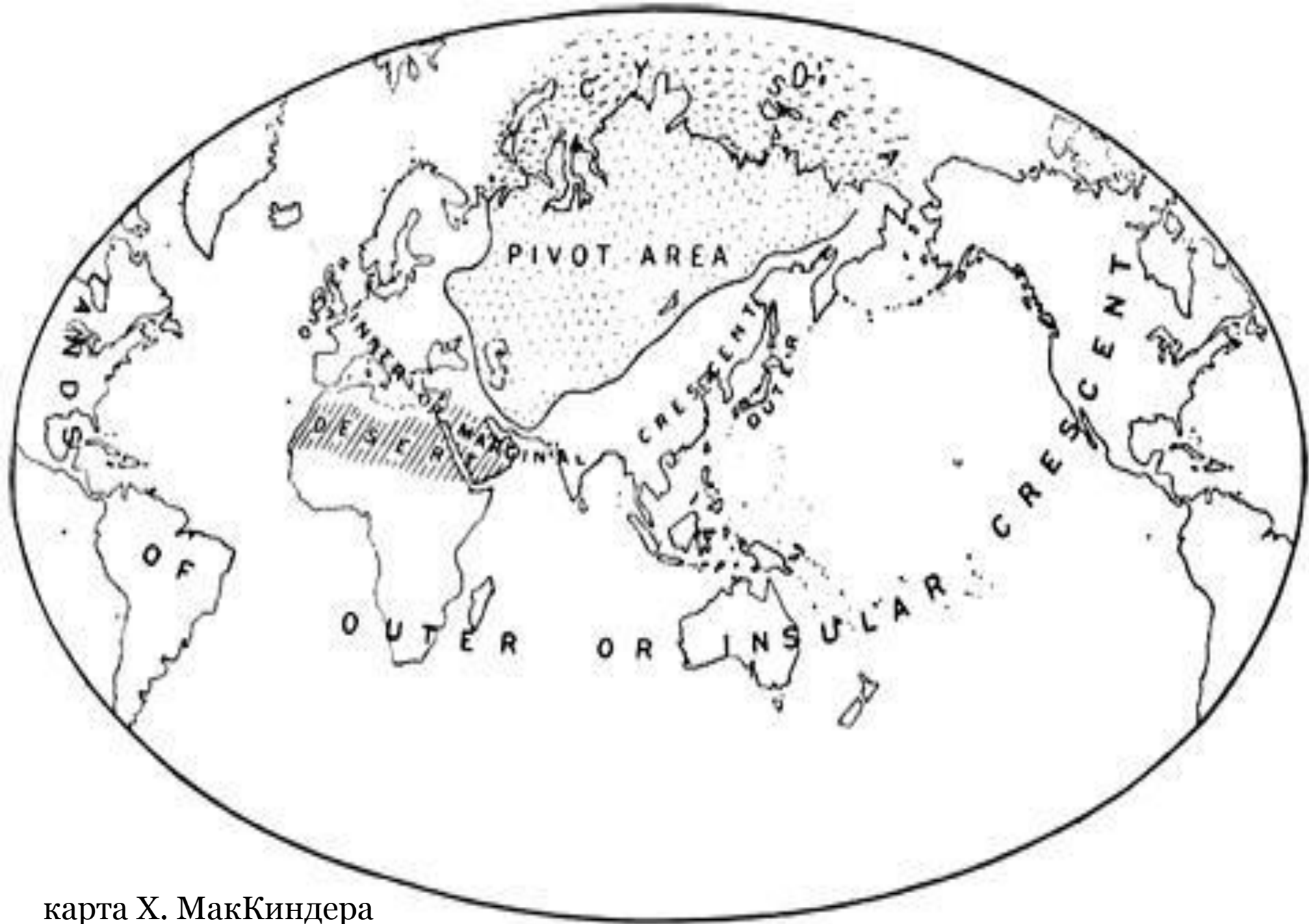
карта Х. МакКиндера