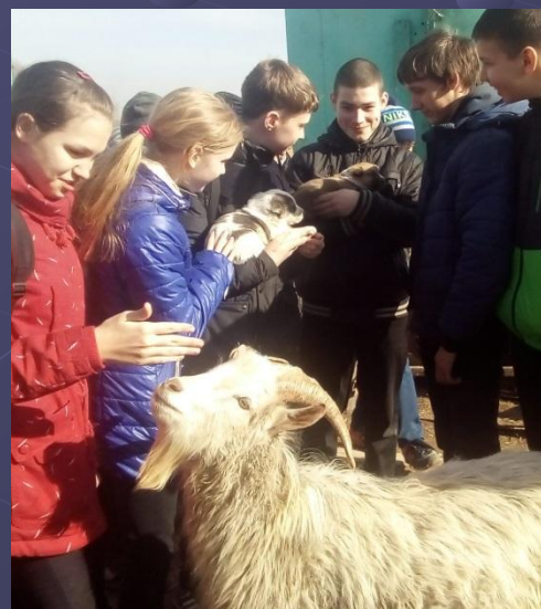
Пообщались С домашней птицей и животными