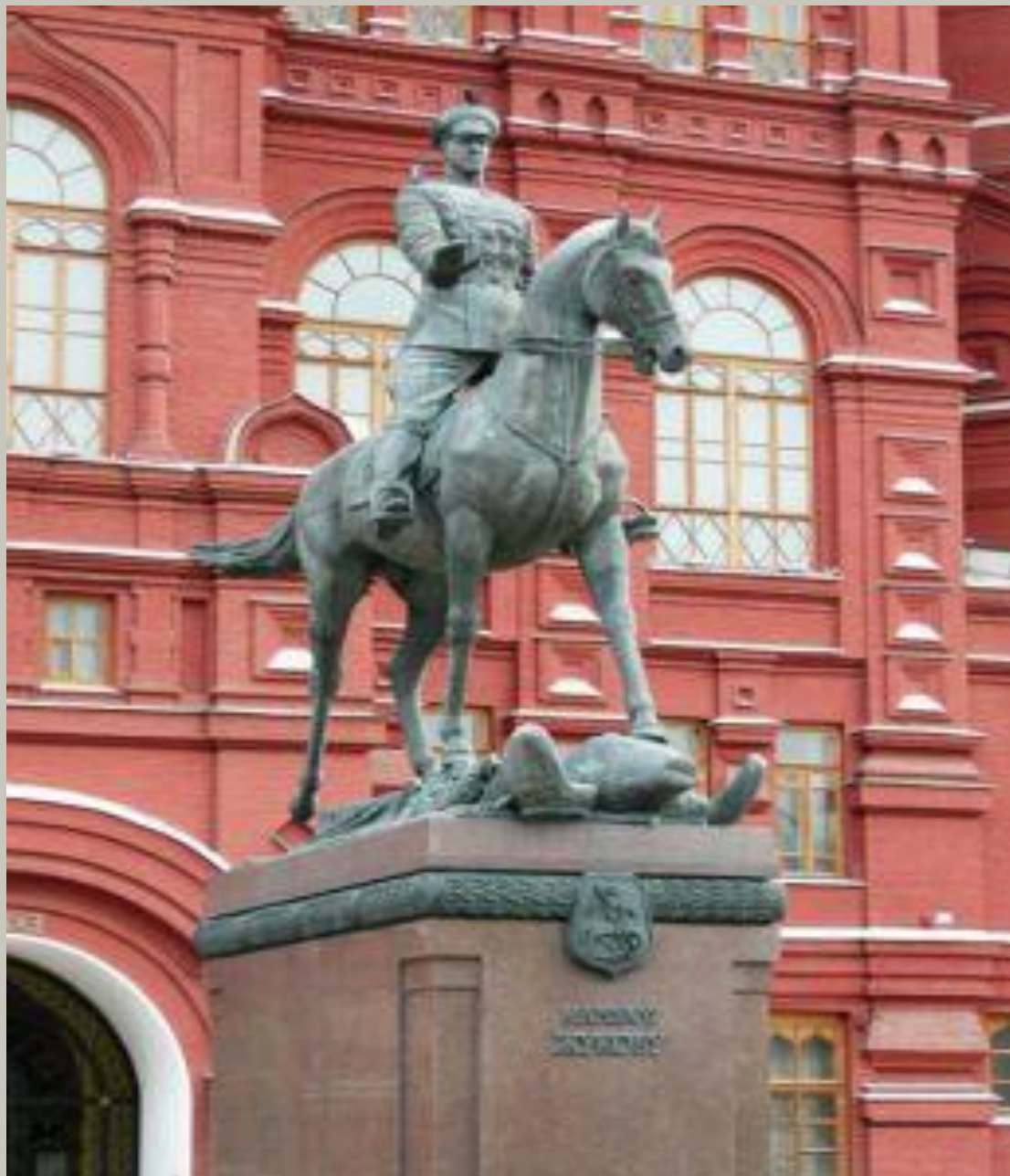
Памятник маршалу Жукову 1995 Скульптор В. М. Клыкова