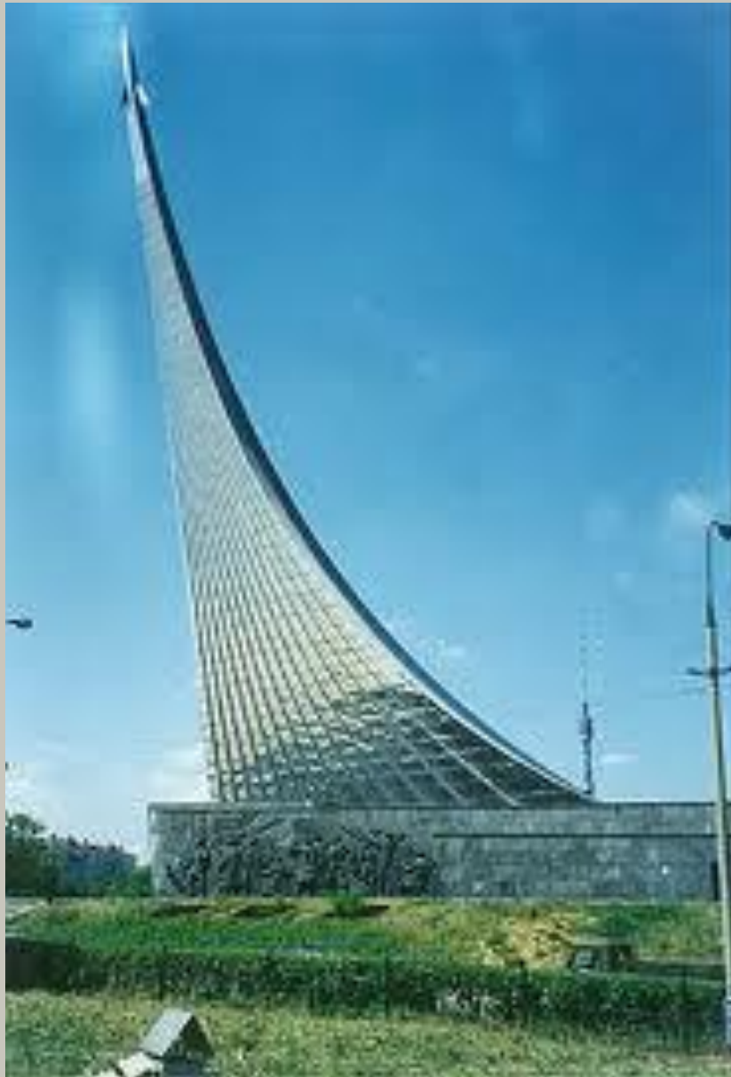
Монумент «Покорителям космоса» 1964 год.