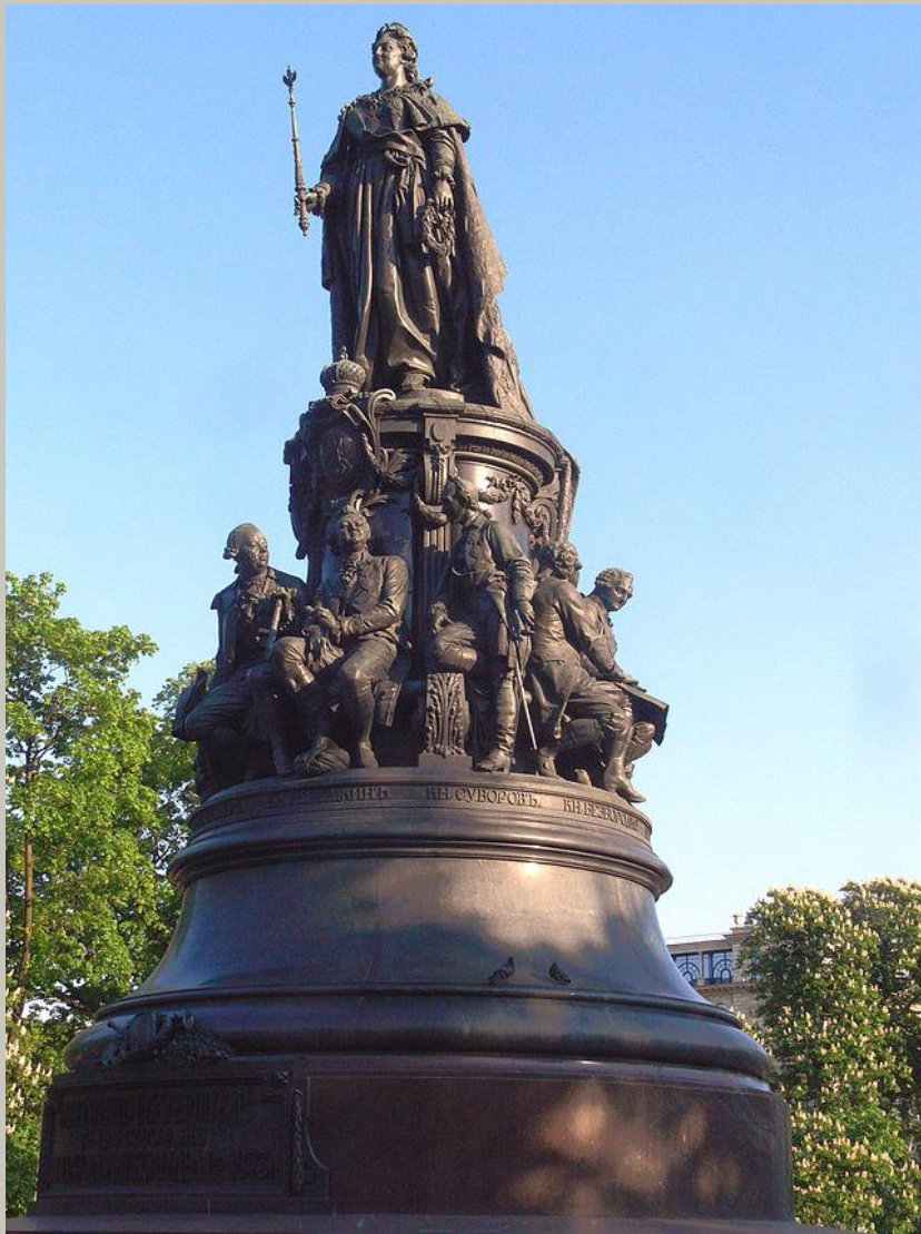
Памятник Екатерине II Санкт-Петербург 1873. Александр Опекушин