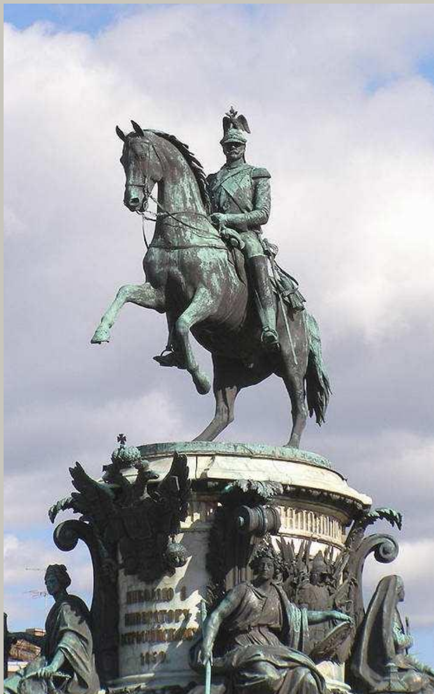
П.К. Клодт. «Памятник Николаю I» 1859