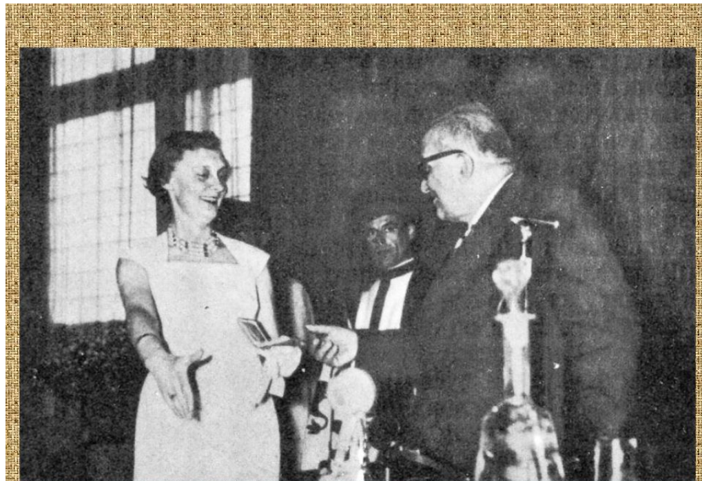
Вручение Линдгрэн медали Андерсена

Ей присуждено огромное количество наград и премий, в том числе Международная золотая медаль Х. К. Андерсена, которую называют «малой Нобелевской», премия имени Льюиса Кэрролла, Международная золотая медаль Льва Толстого, награды ЮНЕСКО, «Серебряный медведь» (за фильм «Ронни, дочь разбойника»).