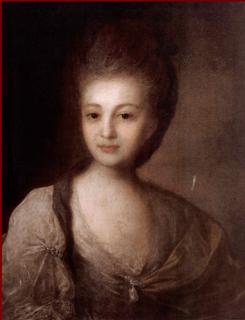
Александра Федоровна Струйская

Любите живопись, поэты! Лишь ей, единственной, дано Души изменчивой приметы Переносить на полотно.