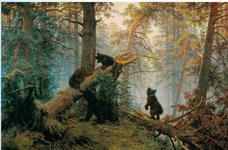
Утро в сосновом лесу