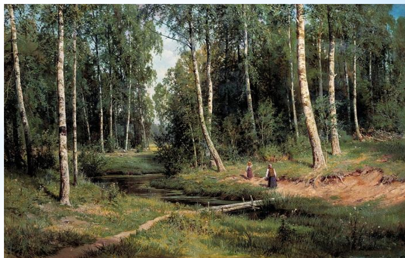
Ручей в берёзовом лесу