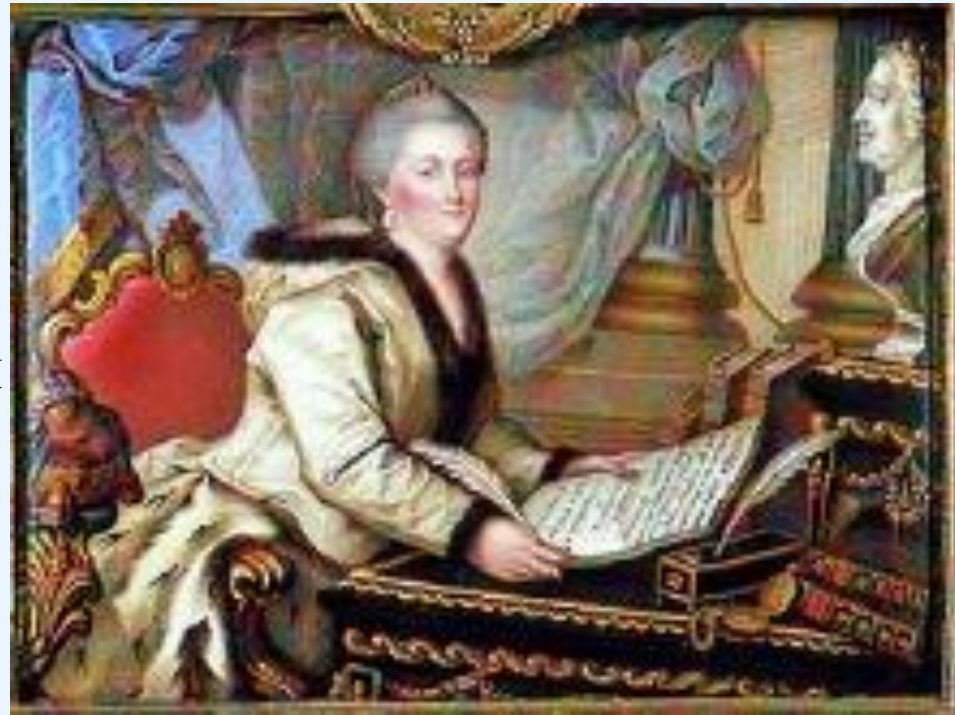
Екатерина II за составлением «Наказа»