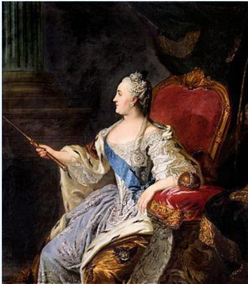
Екатерина II Великая (1762-1796 гг.)