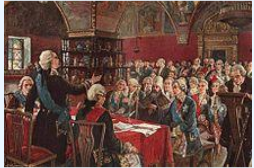
М. Зайцев. Екатерининская комиссия 1767 г.

В 1767 г. Екатерина созвала "Уложенную комиссию", которая должна была подготовить новое Уложение законов. В России все еще продолжало действовать Соборное Уложение 1649 г.