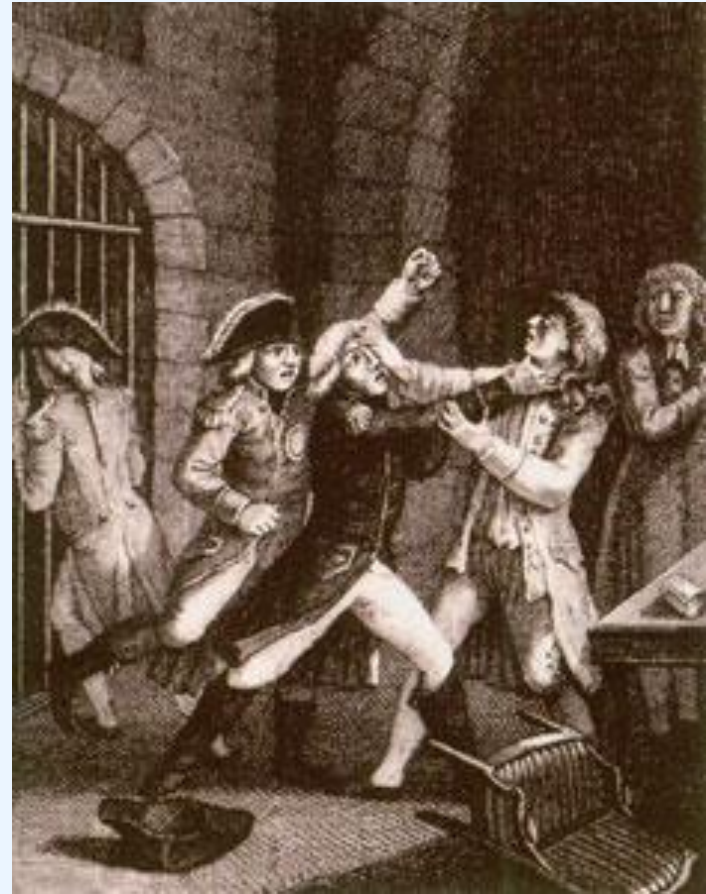
Убийство Петра III

Екатерина, умная, упорная, властная, давно глубоко презиращая мужа, фактически возглавила заговор против него. Ее опорой стали братья Орловы (старший из них, Григорий, был фаворитом Екатерины). Петра III арестовали и содержали под охраной в Ропше, там он и погиб.