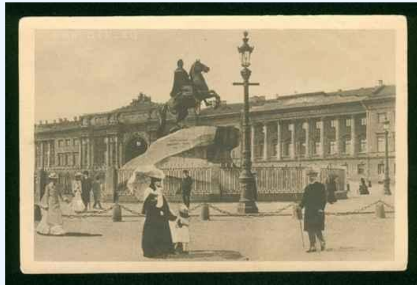
Здание Сената и Синода

Это пополнило казну и позволило прекратить волнения монастырских крестьян.