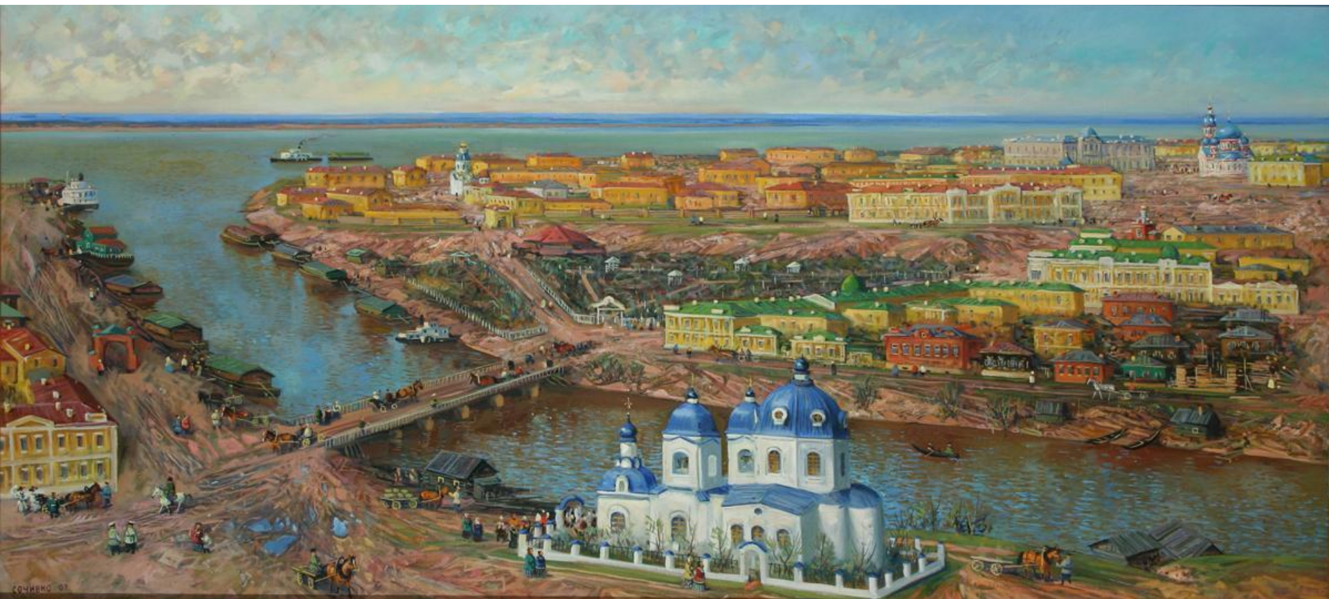
С. Сочивко «Ильинская церковь»