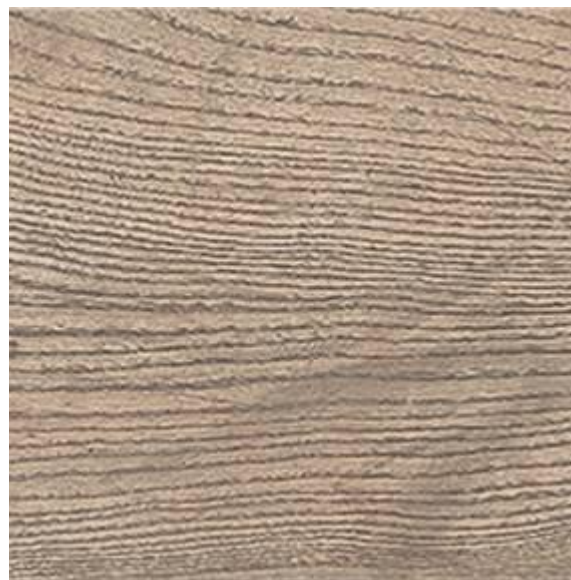
Доска , имитирующая текстуру натурального дерева