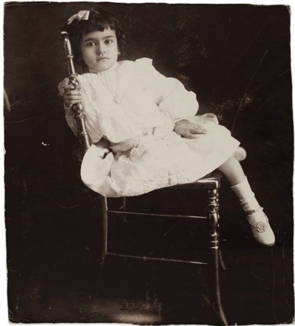
Фото: Фрида Кало. 1912г.