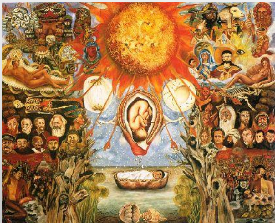
Фрида Кало. «Моисей (Центр мироздания)», 1945г.

В 1953 году проходит первая и единственная персональная выставка Фриды Кало. Сюрреалисты видели во Фриде родственную душу, но она никогда не присоединялась к их группе. Марсель Дюшан, Василий Кандинский, Пикабия, Тцара, поэты-сюрреалисты и даже Пабло Пикассо, оценили уникальность и загадочность этой художницы.