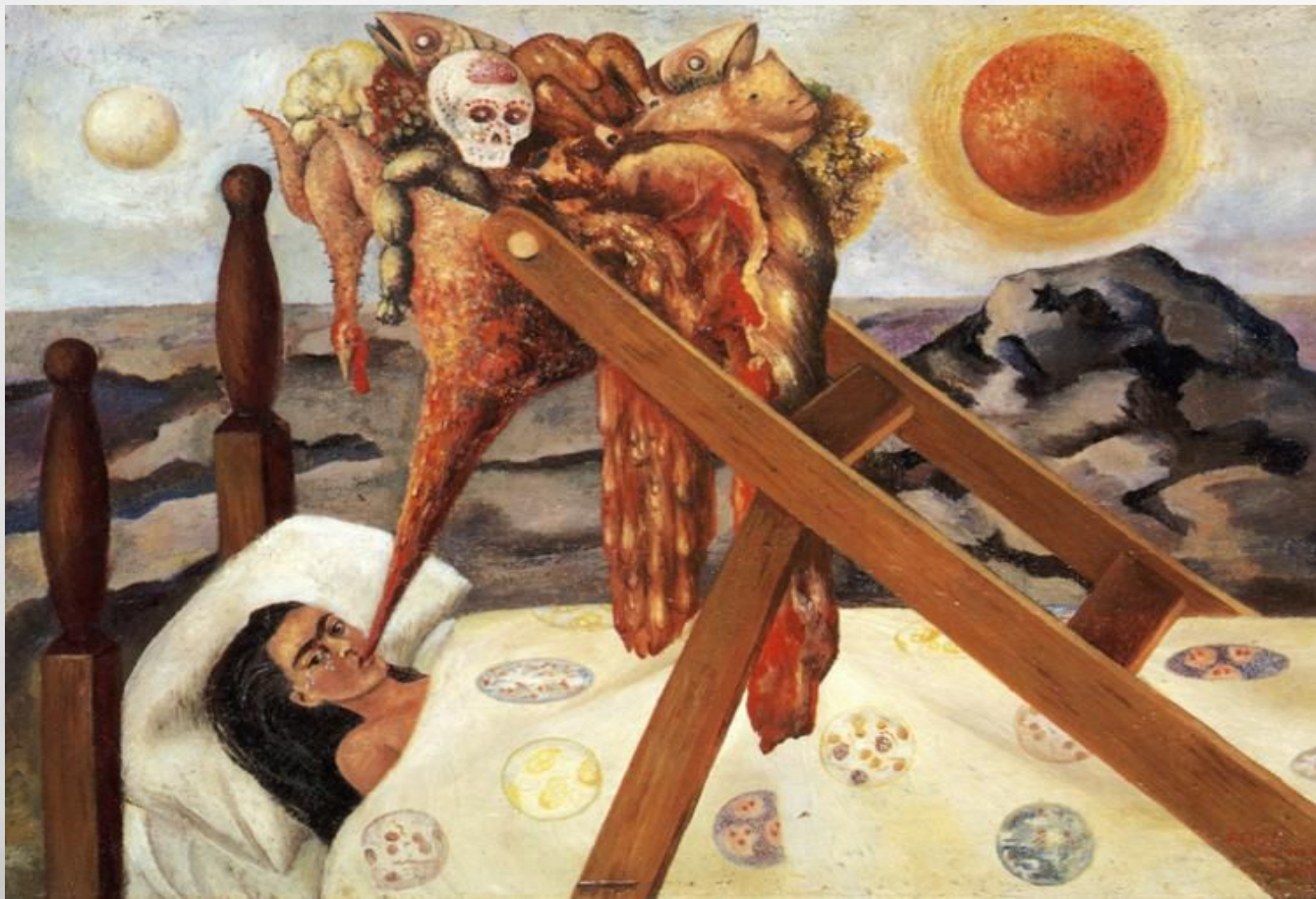
Фрида Кало. «Безнадежность», 1945г.

В 1950 году ей сделали 7 операций на позвоночнике, почти год она провела на больничной койке. Фрида могла передвигаться только в инвалидной коляске. А через два года ей ампутировали правую ногу до колена.