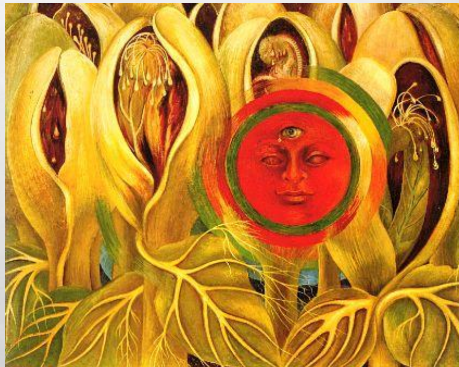
Фрида Кало. «Солнце и жизнь», 1947