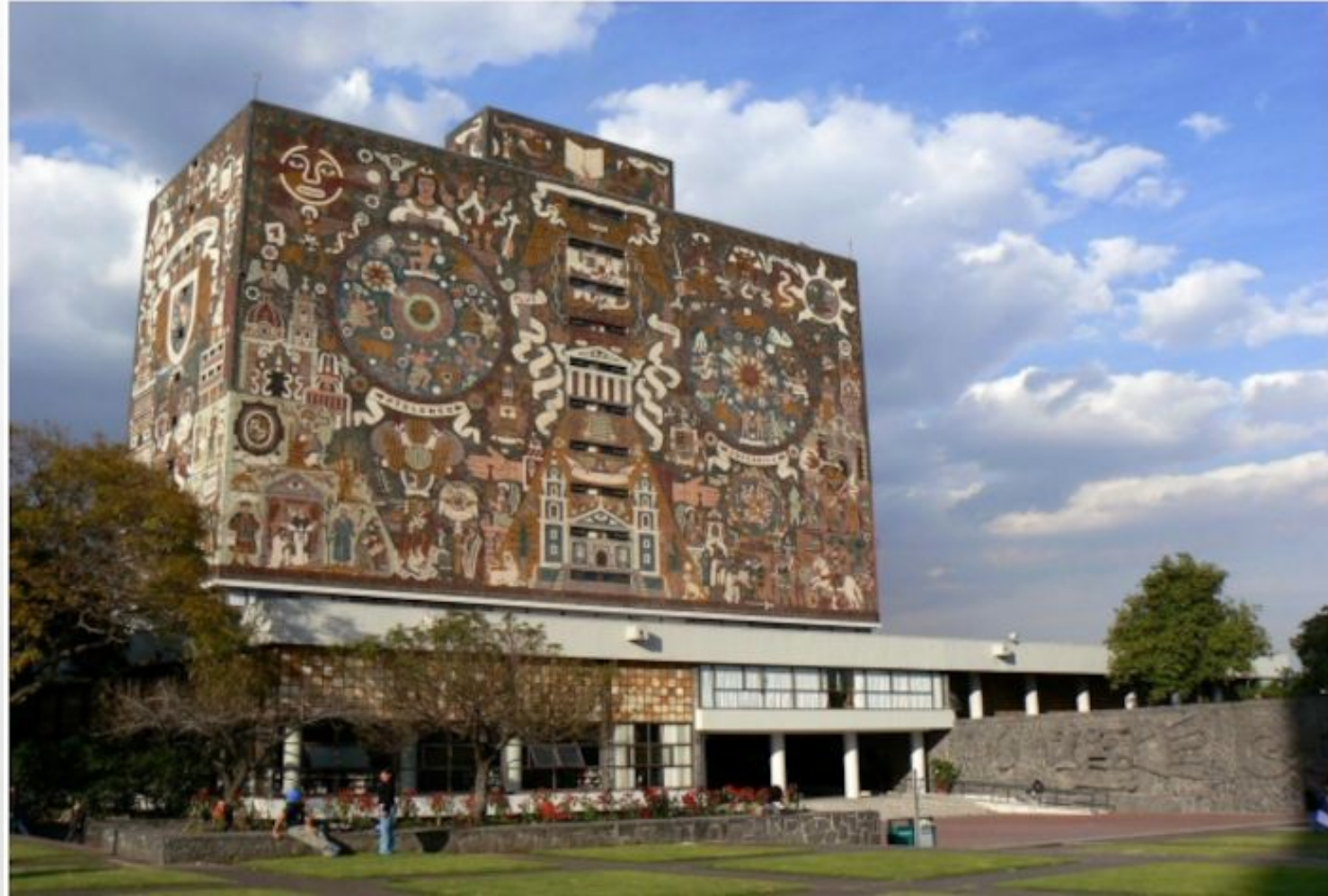
Национальный Институт Мексики

В 22 года Фрида Кало поступила в самый престижный институт Мексики (на 1000 студентов взяли только 35 девушек). Там Фрида Кало встретила будущего мужа Диего Риверу.