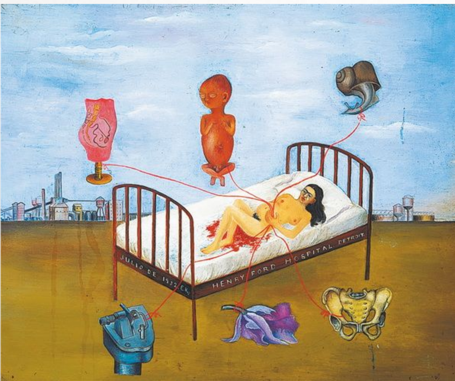
Фрида Кало. «Больница Генри Форда», 1932г.

Фрида мечтала родить Ривере ребенка. Но выкидыши случались один за другим.