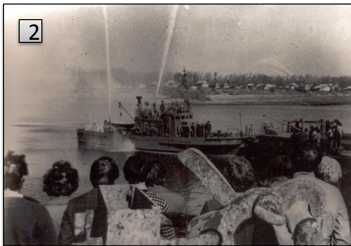
Рис.2. В затоне. Перед открытием субботника по восстановлению ветерана Волжской флотилии "Гасителя". Волгоград. 1975 г.

Фотокаталог №24455