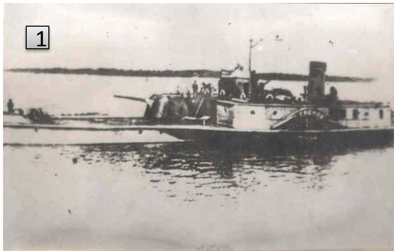
Рис.1. Канонерская лодка "Гром". Участвовала в Великой битве на Волге.

В июле 1942 года, когда Сталинград уже находился под непосредственной угрозой, перед Волжской флотилией были поставлены следующие задачи: быть готовой поддержать сухопутные войска на оборонительном обводе города; обеспечить коммуникацию на участках Камышин-Астрахань; не допустить форсирования противником Волги и обеспечить переправку своих войск.