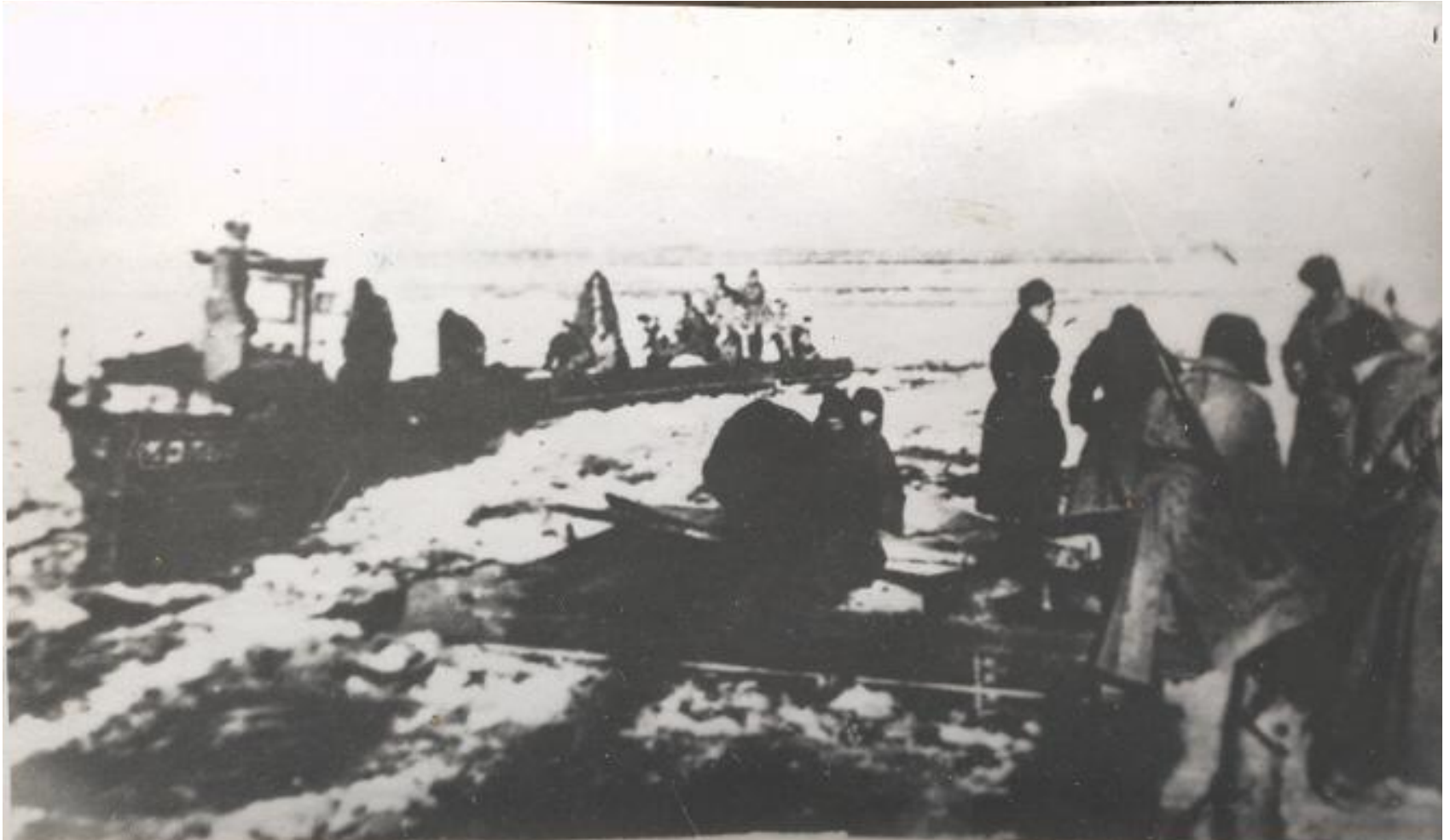
Выгрузка боеприпасов на одном из причалов Центральной переправы. Сталинград. [1942-1943 гг.]