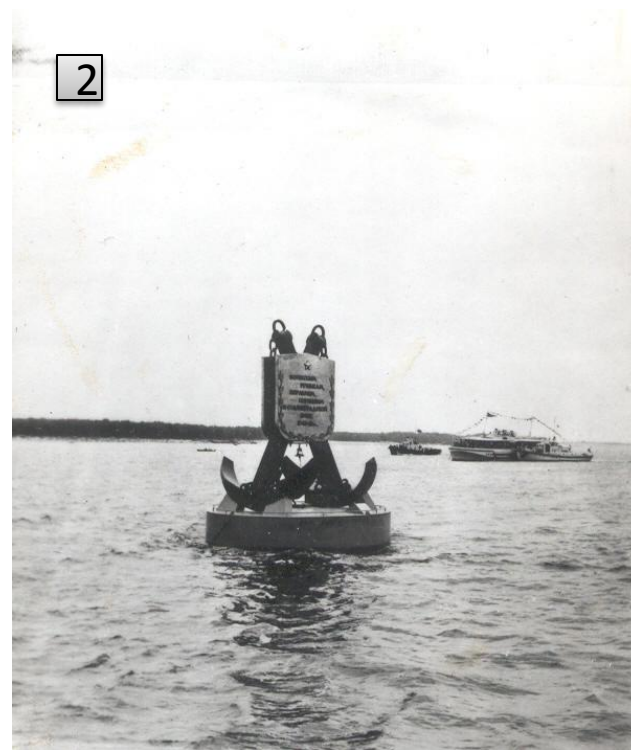
Рис.2. Памятный знак на плаву Волжским речникам и кораблям, погибшим в Сталинградской битве на р. Волге, напротив Мамаева кургана. Центральный район г. Волгограда. 1984 г. Репродукция Л. Еремина//ГКУВО «ГАВО» Фотокаталог №25843