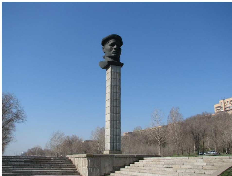
Рис.2. Памятник Героям Волжской военной флотилии. Волгоград. 20.04.2010 г.