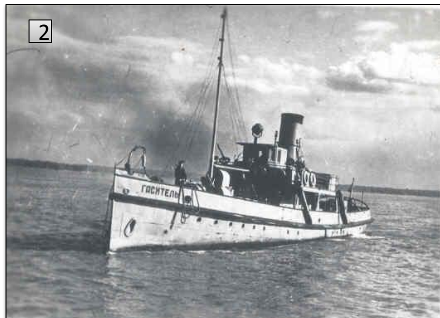
Рис.2. Пожарно-спасательный пароход "Гаситель", участвовавший в героической обороне Сталинграда в 1942-1943 гг.