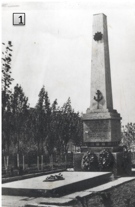
Рис.1. Братская могила моряков Волжской военной флотилии, погибших в боях за Сталинград в 1942 году, поселок Водстрой Тракторозаводского района г. Волгограда. Волгоград. 1984 г. Фотокаталог №25832