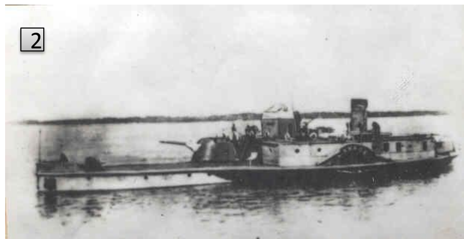
Рис.2. Канонерская лодка "Киров". Участвовала в разгроме немецко-фашистских захватчиков под Сталинградом.

Репродукция Л. Еремина//ГКУВО «ГАВО» Фотокаталог №18428