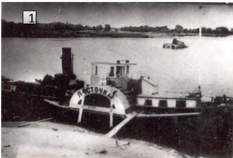
Рис.1. Буксирный рейдовый теплоход "Ласточка" Нижне-Волжского речного пароходства. В дни Сталинградской битвы работал на переправах. Репродукция Л. Еремина //ГКУВО «ГАВО» Фотокаталог №18262