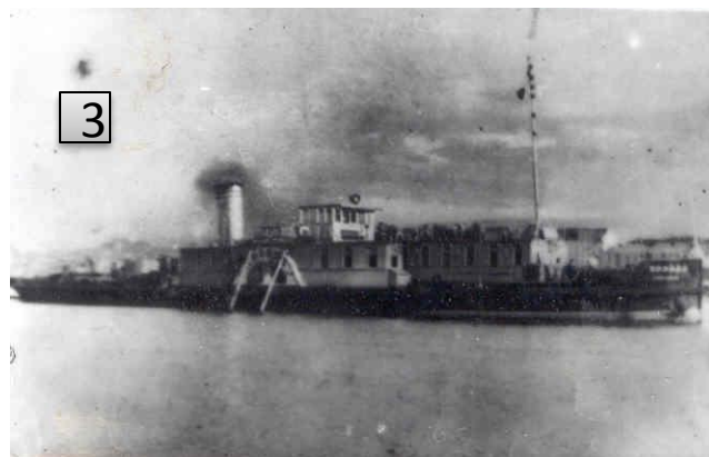
Рис.3. Буксирный пароход "Правда" в составе кораблей ВВФ обеспечивал безопасность судоходства от немецко-фашистской авиации в 1942-1943 гг.