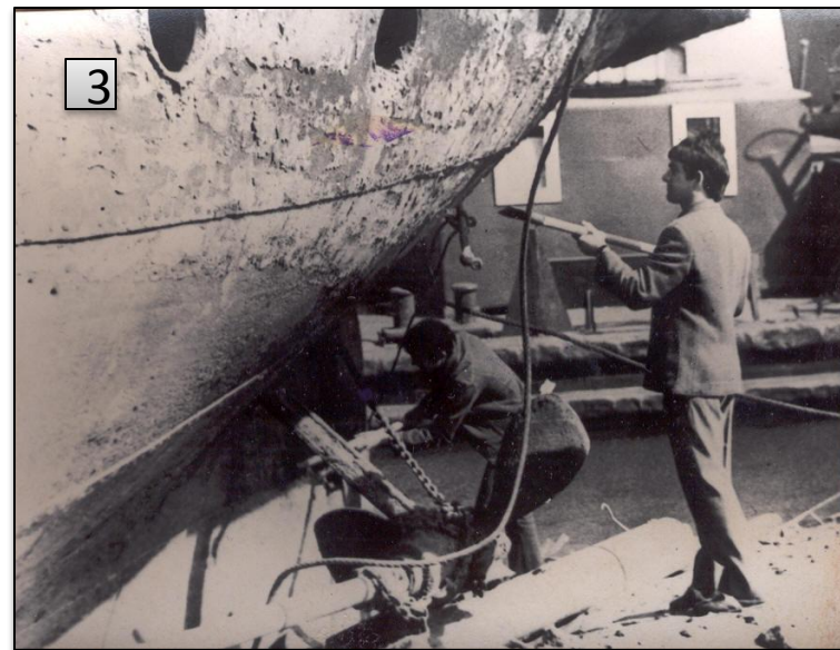
Рис.3. Бойцы строительного отряда "Витязь" ведут работы по восстановлению ветерана Волжской флотилии "Гаситель". Волгоград. 1975 г.

Автор съемки Моисеев. Репродукция//ГКУВО «ГАВО» Фотокаталог №15759