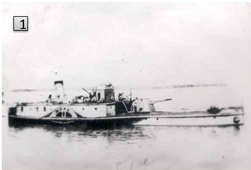
Рис.2. Канонерская лодка «Щорс». Участвовавшая в героической обороне Сталинграда. Репродукция Л. Еремина//ГКУВО «ГАВО» Фотокаталог №18325