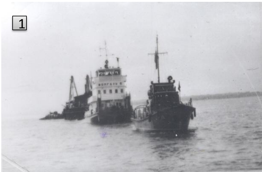
Рис.1. Доставка пожарно-спасательного парохода "Гаситель" на акваторию Волгоградского судоремонтного завода. (Впереди - катер пожарной охраны УВД, затем речной буксир, плавучий кран 7-го экспедиционного отряда судоремонтных работ, "Гаситель". Волгоград. 21.06.1974 г.