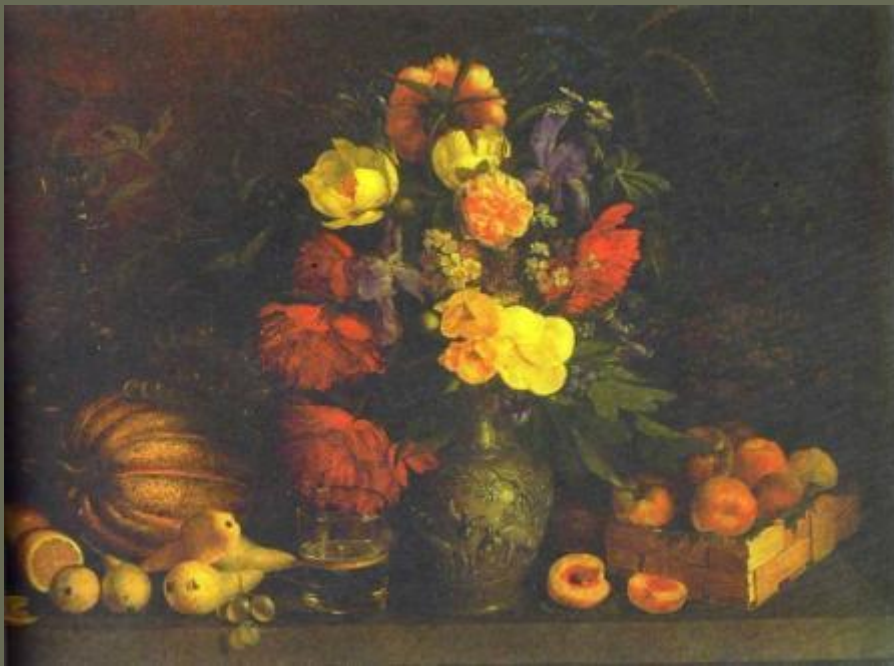
«Цветы и плоды» И.Т. Хруцкой