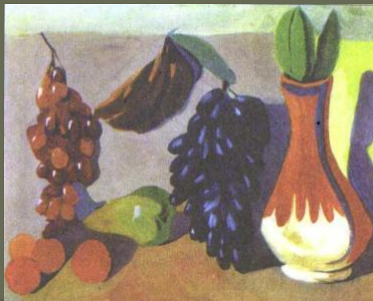
«Натюрморт. Виноград» М. С.Сарьян