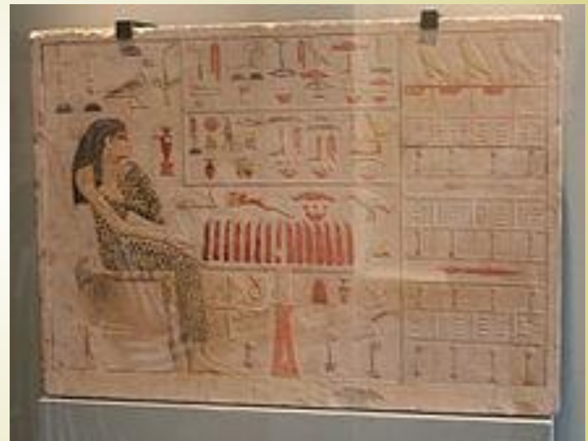
Плитовая стела (ок. 2590—2565 BC) египетской принцессы Неферетиябет из её гроба в Гизе с иероглифами, высеченными и нарисованными на известняке.

Иероглифическое письмо состоит из небольших рисунков предметов. Египтяне называли иероглифы «словами бога» и использовали их для высоких целей, например, чтобы общаться через погребальные тексты с богами и духами загробной жизни.