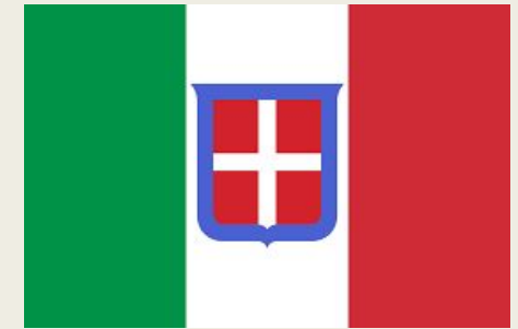
Королевство Италия (1861–1946)

- 1942 г. новый Гражданский кодекс , были изданы Гражданский процессуальный и Навигационный кодексы