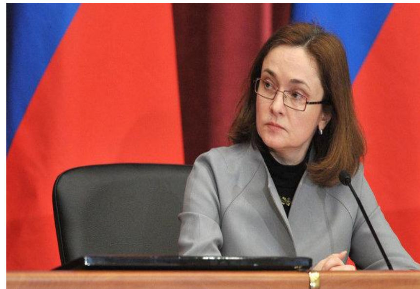
Председатель Центрального банка РФ Набиулina Э. С.