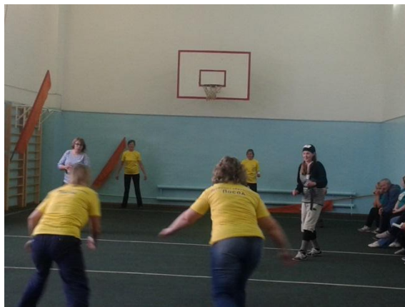
« Вышибало » – команды Посада