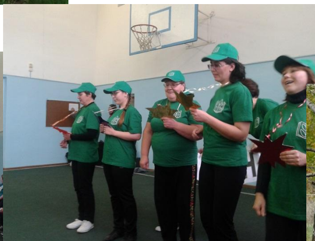
« Визитка » – команда МБОУ «Осинцевская СОШ»