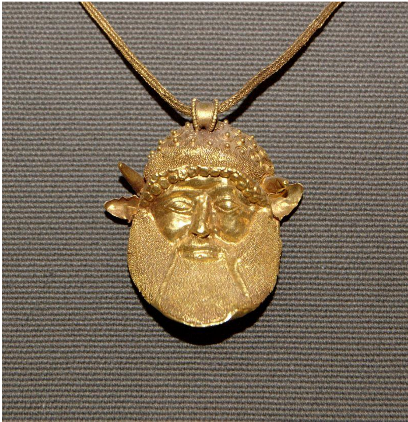
Амулет .Около 460 г. до н. э.