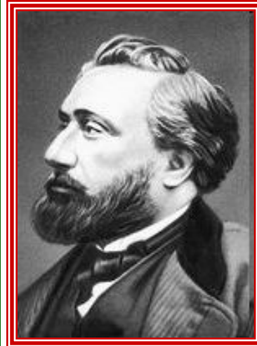
Император Франции Наполеон III