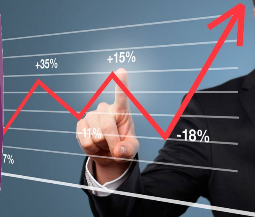
График отслеживания погашения кредитов.