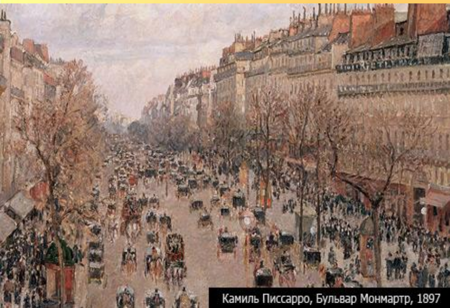
Камиль Писсарро, Бульвар Монмартр, 1897