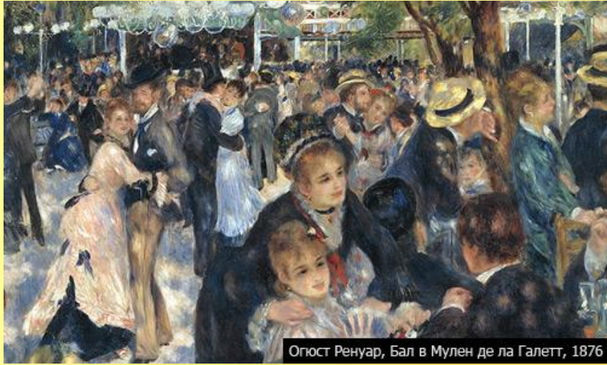
Огюст Ренуар, Бал в Мулен де ла Галетт, 1876