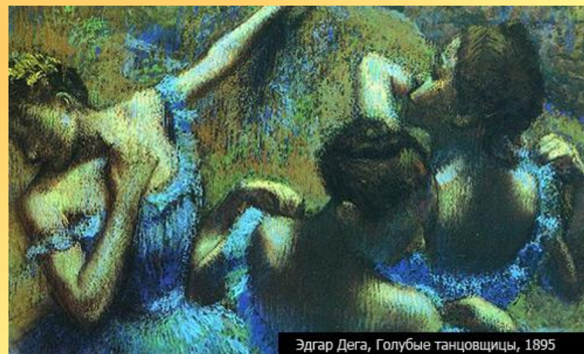
Эдгар Дега, Голубые танцовщицы, 1895