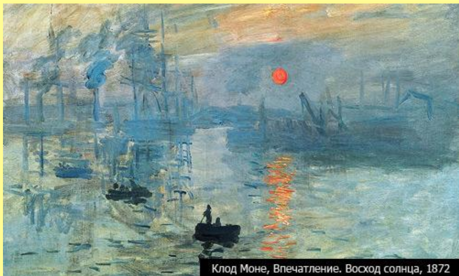
Клод Моне, Впечатление. Восход солнца, 1872