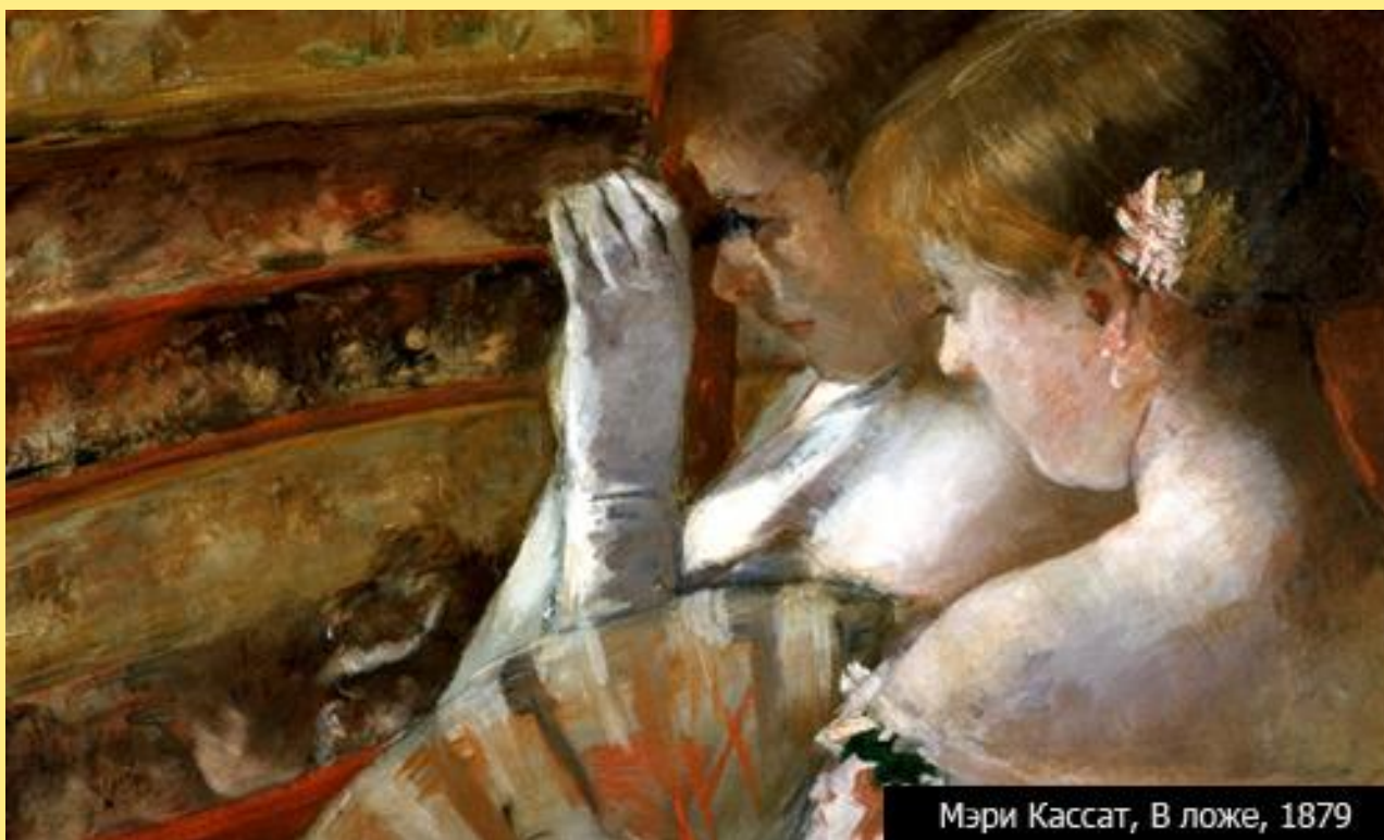
Мэри Кассат, В ложе, 1879