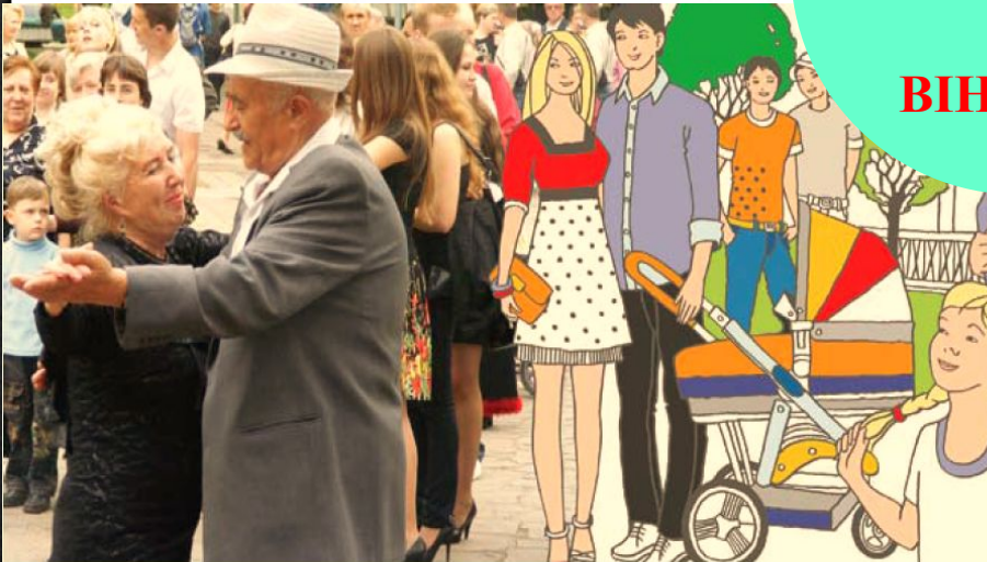
СИЛЬНА ГРОМАДА, ЯКА ДБАЄ ПРО КОЖНОГО ROBUST COMMUNITY CARING FOR EVERYONE