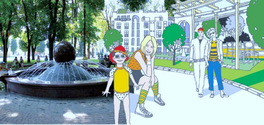
КОМФОРТНЕ І ЦІКАВЕ МІСТО COMFORTABLE AND INTERESTING CITY