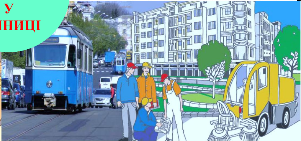
СУЧАСНІ СИСТЕМИ ЗАБЕЗПЕЧЕННЯ ЖИТТЄДІЯЛЬНОСТІ МІСТА MODERN CITY LIFE SUPPORT SYSTEMS