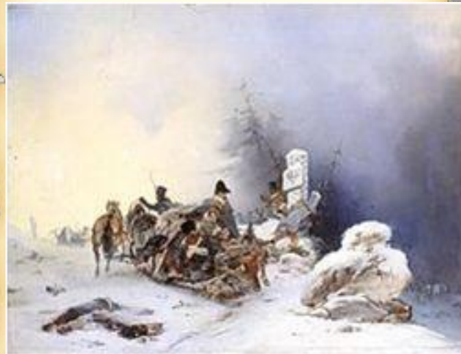
Бегство французов Из России. Виллевальде (1846)