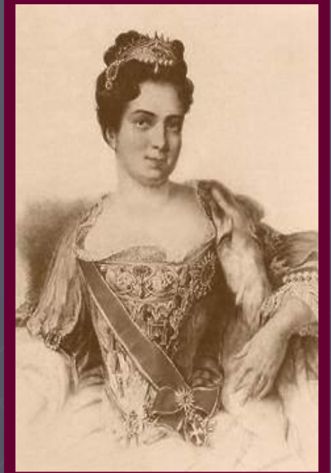
Екатерина (жена Петра)