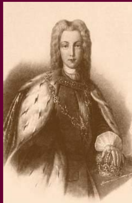
Петр (сын царевича Алексея)