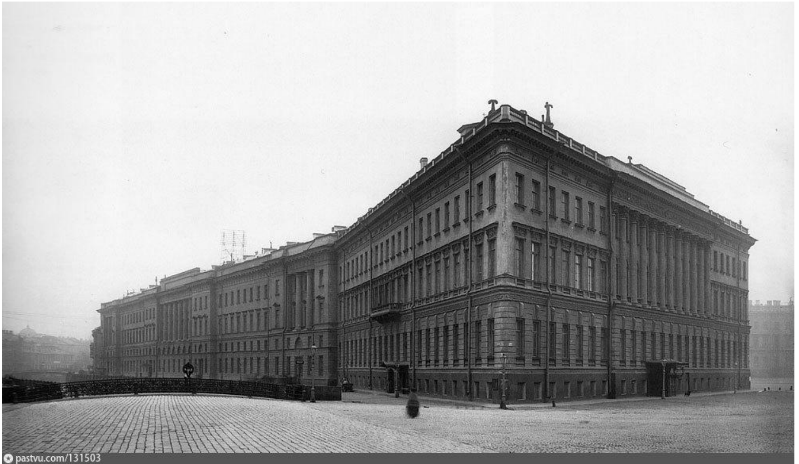
Здание МИДа в 1900 году на Дворцовой площади